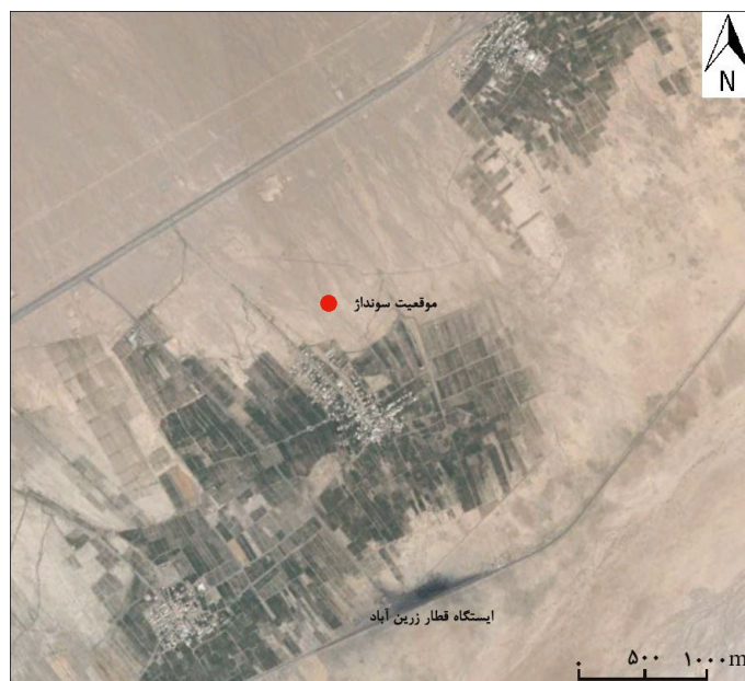
شکل 2: موقعیت محدوده مطالعاتی و سونداژ در نقشه گوگل ارث

الکتریکی تا AB/2، 300 و با آزمون 225 درجه در منطقه مورد نظر با استفاده از دستگاه SAS 1000 ساخت شرکت ABEM کشور سوئد انجام گرفت.