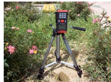
عکس (۲): استقرار متر لیزری بر روی چاهک