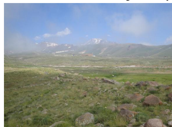
شکل ۴- تصویری از مراتع ارتفاعات فوقانی دامنه جنوبی سبلان در منطقه آلوارس در ارتفاع ۳۰۰۰ متری

ناحیه غرب، عناصر رویشی گیاهی آنها بویژه در ارتفاعات فوقانی جلوه‌ای خاصی دارد، سنوزی‌های بهاری و تداوم رویش گیاهان تا آخر تابستان از ویژه گیاهی آن منطقه