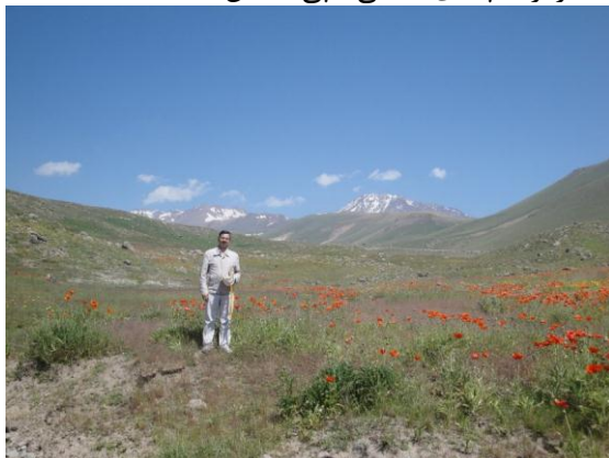
شکل ۵- تصویری از مراتع آلپ دامنه شرقی سبلان و تصویر مجری طرح (نگارنده اول مقاله).