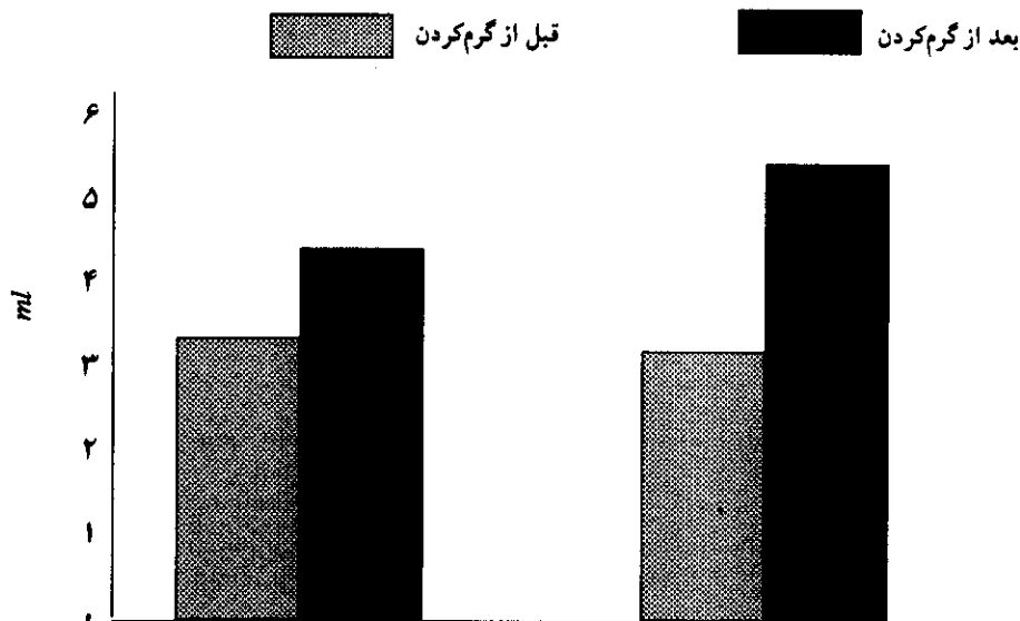
اسیدلاکتیک خون در گروه ۱۰ دقیقه‌ای اسیدلاکتیک خون در گروه ۱۵ دقیقه‌ای نمودار ۳- مقایسه اسید لاکتیک خون دو گروه قبل از گرم کردن و پس از گرم کردن