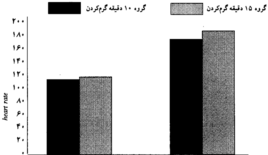
نمودار ۲- مقایسه ضربان قلب دو گروه پس از گرم کردن و فعالیت درمانده ساز