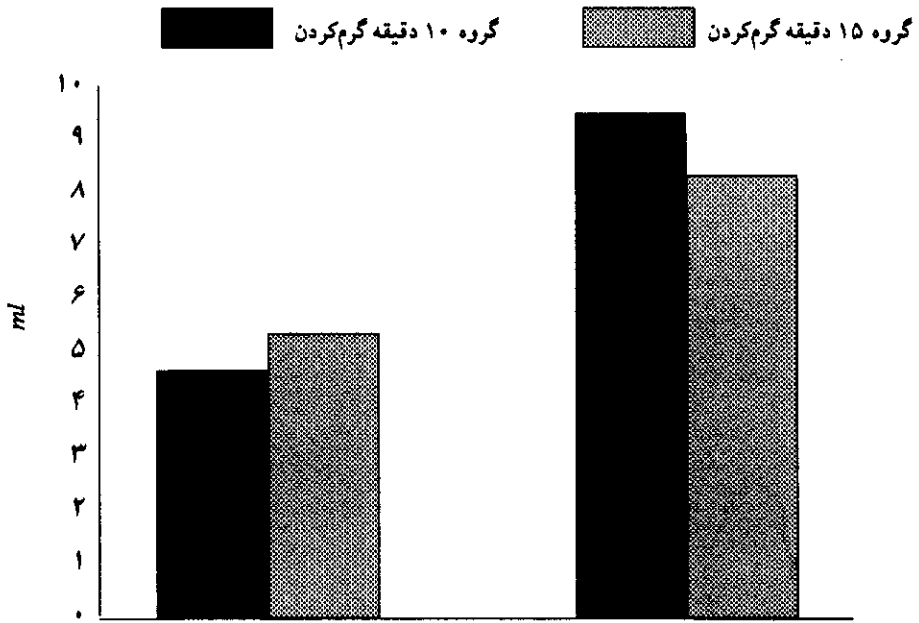
نمودار ۱- مقایسه لاکتات خون دو گروه پس از گرم کردن و فعالیت درمانده ساز