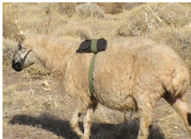
شکل ۲: دام انتخاب شده و نحوه بسته شدن دستگاه به گوسفند نژاد کرمان

روز معین از فصل چرا در هر ماه طی سالهای ۱۳۸۹-۱۳۸۷ رفتار دام ثبت گردید. اندازه گیریها در ماههای اردیبهشت، خرداد، تیر، مرداد، شهریور، و مهر در روز مشخصی (بیست و هشتم هر ماه) تکرار شد. مسیر حرکت دام در هر ماه مسیری بود که چوپان انتخاب می کرد. در هر ماه از فصل چرا به هنگام خروج دام از آغل دستگاه تنظیم و به دام مورد نظر بسته می شد. زمان مراجعت دام از مرتع در پایان روز، دستگاه از روی دام برداشته شد (شکل ۲) و با استفاده از نرم افزار Map source اطلاعات از دستگاه اخذ و استخراج گردید. با استفاده از نرم افزار ArcGIS از روی نقشه توپوگرافی منطقه ابتدا مدل رقومی ارتفاع DEM ساخته شد، سپس نقشه شیب منطقه مورد مطالعه تهیه و با همپوشانی مسیر حرکت دام با نقشه شیب مسافت پیموده شده توسط دام در طبقات مختلف شیب بدست آمد. دادههای بدست آمده در سالهای آمار برداری با استفاده از نرم افزار SAS در قالب طرح پایه بلوک کامل تصادفی مورد تجزیه تحلیل قرار گرفت و با استفاده از آزمون چند دامنه ای دانکن میانگین ها مقایسه شد.