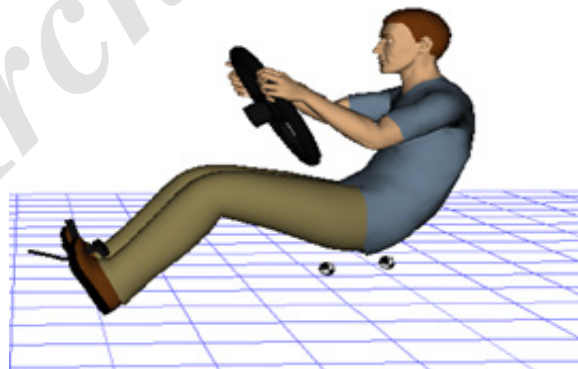
شکل ۳. اعمال پارامترهای بهینه پکیج و نحوه استقرار ارگونومیک راننده در نرم افزار JACK

مبنای نشستن راننده (AHP) یعنی L11 دارند؛ از این رو تغییرات این دو پارامتر بیشترین تأثیر ارگونومیک را بر ارگونومی و شرایط راحتی راننده دارد؛ بنابراین با آنالیز ماتریس هم‌بستگی می‌توان در مورد تأثیر تغییر هر پارامتر (۶ پارامتر ورودی) بر خروجی‌های ارگونومیکی (۱۰ زاویه ارگونومی بدن) قضاوت کرد.