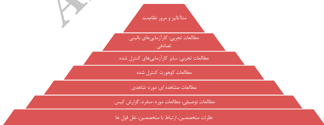
شکل ۲. سطوح طبقه‌بندی شواهد Greenhalgh (۹)

مرور حاضر به صورت نظام‌مند به بررسی، مطالعات انجام شده روی کاربرد چارچوب ICF در اختلالات گفتار و زبان کودکان پیش‌دبستانی پرداخته است. عبارت‌های «ICF» و اختلالات ارتباطی، ICF و اختلالات زبانی، ICF و اختلالات گفتاری» به عنوان کلید واژه‌های جستجو در بازه زمانی سال‌های ۲۰۰۵ تا ۲۰۱۵ در پایگاه‌های اطلاعاتی PubMed و Web of Knowledge به عنوان جامع‌ترین پایگاه‌های موجود در حوزه پزشکی، توان‌بخشی و رشته‌های وابسته در نظر گرفته شدند. زبان انتخابی مقالات، انگلیسی و محدوده سنی، مطالعه روی کودکان پیش‌دبستانی بود. جستجو در پایگاه