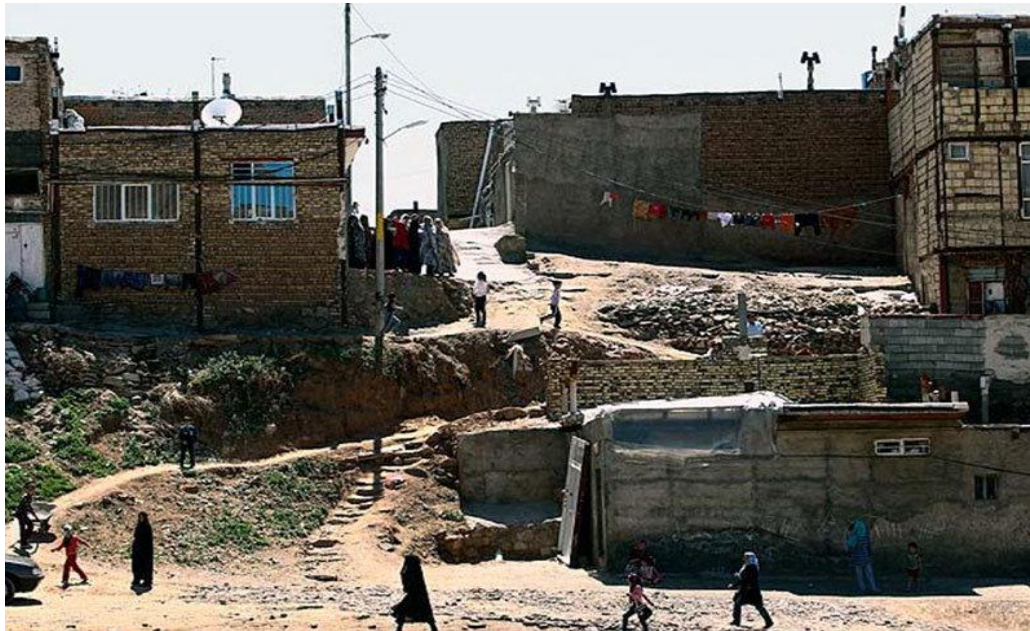
شکل مربوط به حاشیه نشینی. شکل ( ۲ )

اگر مهاجرت را از علل رشد و گسترش بدانیم، مشارکت اجتماعی و کیفیت آن از پیامدهای حاشیه نشینی است. مشارکت در امور شهر و محله از جمله مواردی است که در کیفیت زندگی و سالم سازی محیط نقش اساسی دارد. از نظر میلبرات و گوئل مشارکت به چهار عامل بستگی دارد: انگیزه، موقعیت اجتماعی، ویژگی های شخصی و محیط اجتماعی/سیاسی؛ مثلاً هر اندازه فرد بیشتر در معرض انگیزه های سیاسی مانند بحث درباره ی سیاست بوده باشد و یا اطلاعات سیاسی دسترسی داشته باشد احتمال مشارکت سیاسی او بیشتر می شود. موقعیت اجتماعی که به میزان تحصیلات، محل سکونت، طبقه و قومیت سنجیده میشود که بر میزان مشارکت بسیار تاثیر گذار است. محیط یا زمینه نیز بسیار مهم است، از این نظر که مثلاً فرهنگ سیاسی ممکن است مشارکت یا اشکال خاصی از مشارکت که پسندیده است (مثل شرکت در انتخابات) را تشویق کند یا مانع آن شود. (برداشت آزادراش، ۱۳۷۷)