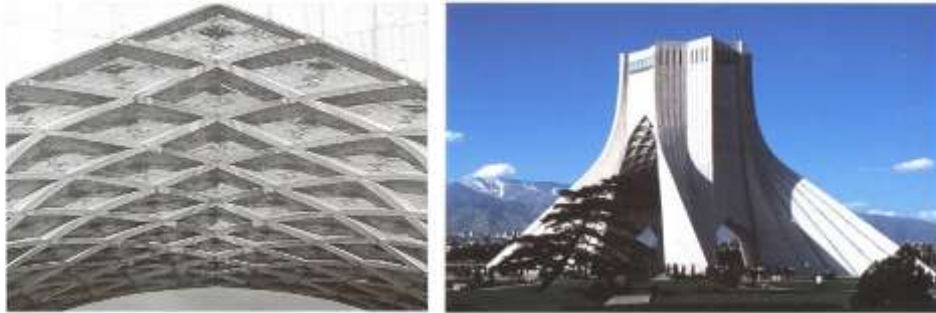
شکل 1- استفاده از معماری اسلامی در بنای میدان آزادی

❖ بنای میدان آزادی: معماری برج آزادی تلفیقی از معماری دوران هخامنشی، ساسانی و اسلامی است.