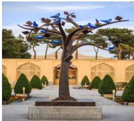
شکل 3- استفاده از نقوش گیاهی و حیوانی و هندسی هنر اسلامی

❖ استفاده از نقوش گیاهی و حیوانی هنر اسلامی در زیباسازی شهر اصفهان