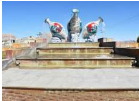
شکل 2- کاربرد هنر اسلامی در فضای شهری شهرستان شهرضا، استفاده از کوزه های سفالین

❖ «میدان کوزه» شهر شهرضا: در این طرح از نقش ماهی استفاده شده زیرا این نقش در سفال اصیل شهرضا همیشه مدنظر هنرمندان سفالگر بوده و استفاده می شده است.