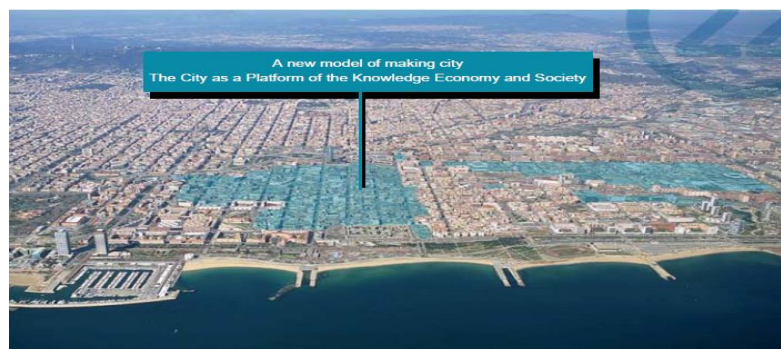
شکل شماره ۱: Barcelona@22؛ خوشه‌های دانش‌محوری بارسلونا مأخذ: (۱۱)

خلاق و دانش‌محور آن را اجرا نموده است. پروژه Barcelona@22 برای تجدید حیات ناحیه پابل‌نیو بر اساس ترکیبی از اطلاعات، طرح، IT، موسیقی و دیگر تجارت‌های خلاق، که همراه با فراساختارهای ارتباطی و شکلی یا خانه‌سازی، طراحی شد (۱۰ و ۱۱).