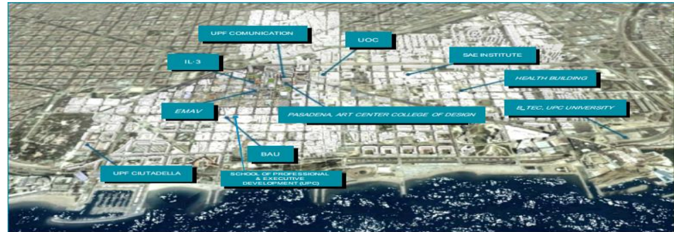
شکل شماره ۲: ۱۰ دانشگاه با ۲۵۰۰۰ دانشجو

خطوط دوچرخه، عابرین پیاده و ترانزیت به نحو مطلوبی یکپارچه شده است. همچنین بارسلونا جهانگردی خلاق را در دستور کار خود قرار داده و به سرعت بر اساس میراث گسترده خودش، بازار جهانگردی فرهنگی را شکل داده است.