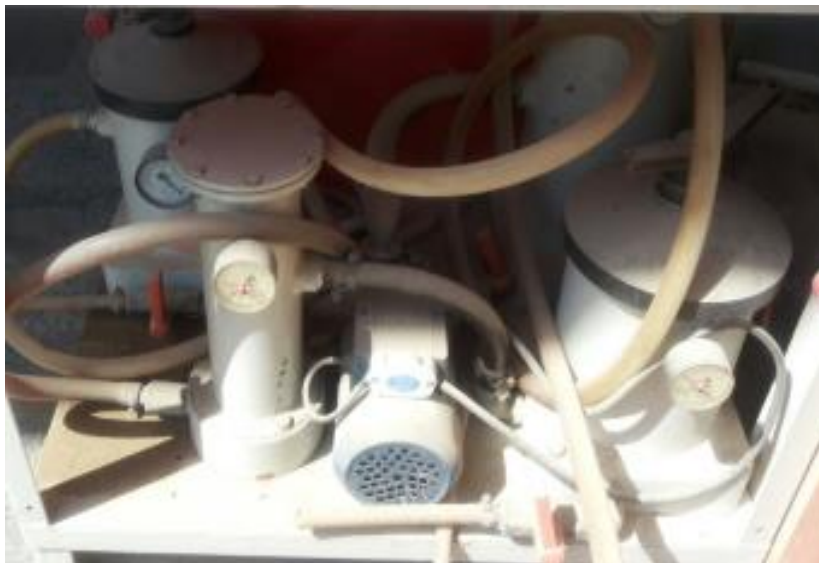
شکل ۱- پایلوت نانوفیلتراسیون مورد مطالعه