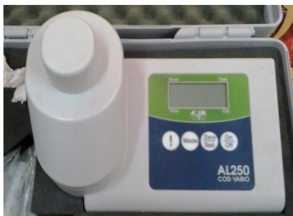
شکل ۲- دستگاه COD متر ساخت شرکت آکوآلیتیک آلمان

COD یکی از مهم‌ترین شاخص‌های سنجش آلودگی فاضلاب صنعتی است. بنابراین برای تعیین مقدار مواد خارجی فاضلاب به جای اندازه‌گیری مستقیم آن‌ها، مقدار اکسیژن مورد نیاز آن‌ها برای اکسید شدن را محاسبه می‌نمایند. در این پژوهش، اندازه‌گیری COD با دستگاه COD متر و طبق دستورالعمل مندرج در کاتالوگ مربوطه با تواتر سه روز یکبار انجام شد (شکل ۲).