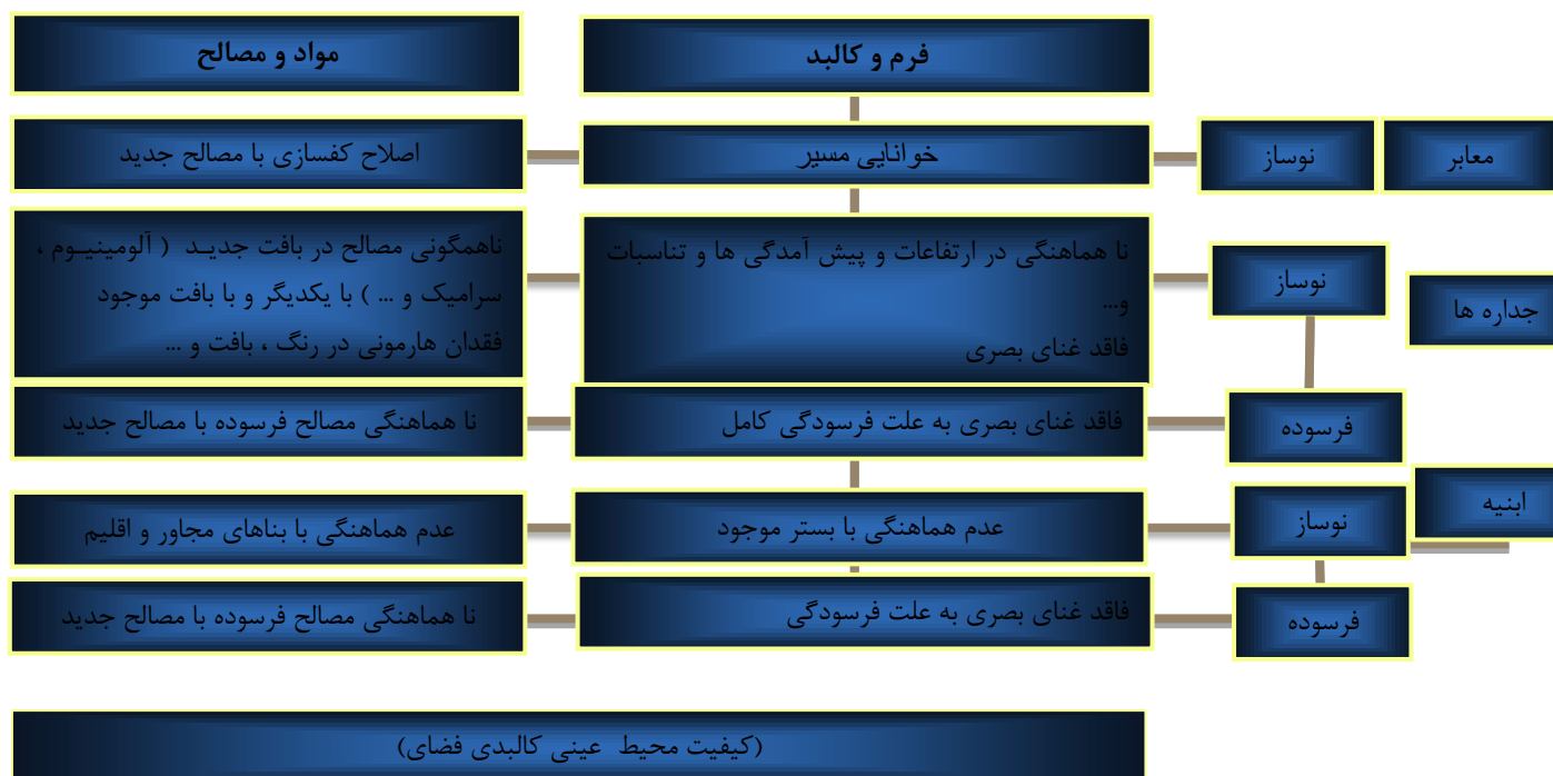
نمودار 3- مؤلفه های تجربی زیبایی شناختی در فضاهاى جداره خارجى

محله کوچه ماهانی که در سالهای اخیر به نام خیابان "مادر" تغییر نام یافته است یکی از محلات قدیمی شهر کرمان می باشد و به محدودهای از شمال به میدان مشتاق از شرق به خیابان 17 شهریور، از جنوب به محله سلسبیل و از غرب به میرزا رضای کرمانی منتهی می شود.