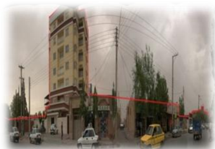
ناهمانگی در ارتفاع، ناهماهنگی در مصالح

خط بام: پرهیز از تراکم ساختمانی بلند مرتبه نا هماهنگ با بافت بعنوان مانعی برای دید بصری کامل به سایت