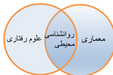
شکل 1- روانشناسی محیطی محل اتصال علم معماری و علوم رفتاری

طراحی شده، پیوندی ناگسستنی بین روان شناسی محیطی و طراحی ایجاد کرده است. روانشناسی محیطی یکی از رشته های تخصصی نوپایی است که به تأثیر متقابل رفتار و عوامل و شرایط فیزیکی معماری و فضای محیط، بیش از دیگر جنبه ها اهمیت داده است. امروزه توجه به جایگاه علوم رفتاری در طراحی شهری و معماری و چگونگی تأثیرگذاری فضا بر بروز رفتار انسانی از جمله مواردی است که نیازمند بررسی و بازبینی مفهومی و عملیاتی است که ترسیم کننده جایگاه واقعی علم روانشناسی محیطی در طراحی معماری باشد. در واقع آشنایی طراحان شهری با دانشهایی همچون علوم رفتاری و روانشناسی محیطی می تواند این امکان را برای طراحان فراهم کند تا منطبق بر نیاز و فرهنگ استفاده کنندگان فضاها را طراحی کنند. برودینت (1977) معتقد است که تمام ساختمان ها، خوب یا بد معنایی را منتقل می نمایند و به شکل نمادی از مفاهیم درونی خود برای ناظران به شمار می آیند جنکز (1969) عقیده دارد که همزمان با خلق یک فرم کالبدی معنی آن نیز همراه با آن شکل می گیرد و این معانی است که محیط و انسانها را با هم مرتبط می نماید. به گفته ی راپاپورت (1982) اگر چه موقعیت اجتماعی افراد در شیوه ی برخورد و رفتار آنان بسیار مؤثر است ولیکن نشانه های محیطی معانی لازم جهت تنظیم رفتارها را منتقل می نماید محیط به نوعی ارتباط غیر کلامی با ناظران برقرار می سازد.