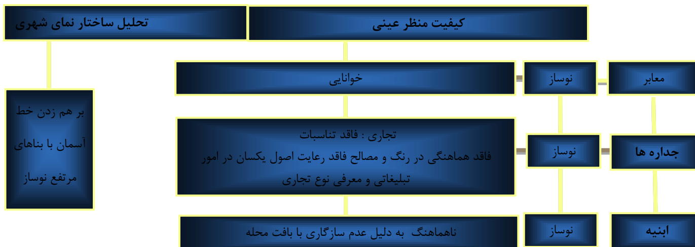
نمودار 4- مؤلفه های تجربی زیبایی شناختی در فضاهای جداره خارجی