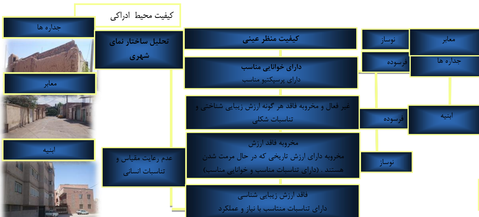
نمودار 5- مؤلفه های تجربی زیبایی شناختی در جداره ی داخلی