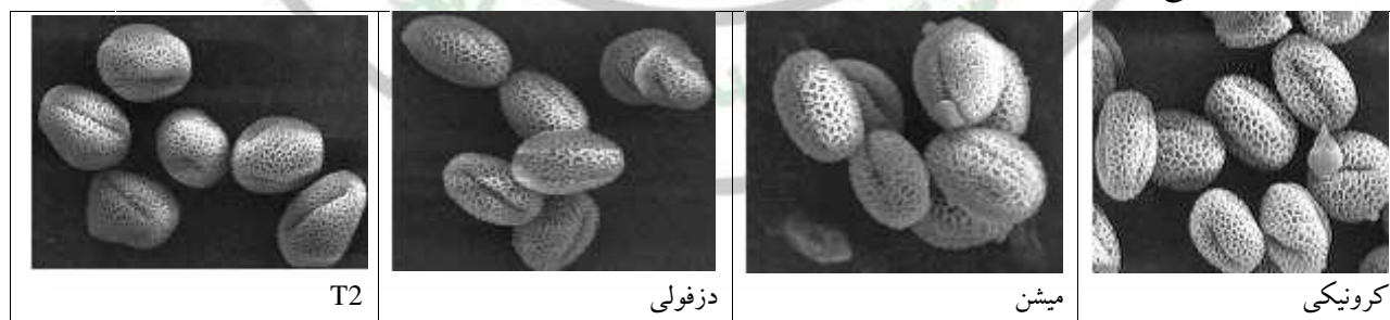
شکل ۱- شکل گرده ارقام (T2، دزفولی، میشن و کرونیکی) زیتون بر اساس SEM (با بزرگنمایی \times 2000 ).