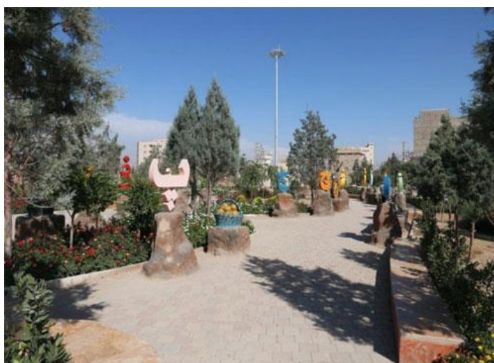
شکل شماره ۴: پارک کلمی جونتری

دوستدار کودک فضایی برای تفریح، تفریح، آموزش و آمادگی برای ورود به اجتماع مختص گروه های مختلف سنی کودکان و نوجوانان است. با توجه به اینکه عمده ویژگیهای شخصیتی انسان در سالهای اولیه کودکی (پیش از دبستان) شکل می گیرد و با توجه به نقش محیط بر انسان، چه به لحاظ واکنش درونی و چه به لحاظ بیرونی، طراحی محیط کودک باید بر اساس مبانی نظری مبتنی بر ویژگیها و نیازهای کودکان، چگونگی ادراک منظر و محیط توسط آنان و با توجه به تاثیر محیط بر رشد همه جانبه و ارتقای فعالیتهای جسمی، فکری و موفقیت کودکان صورت پذیرد. این بوستان دارای فضاهای خاص جهت پرورش، آموزش و بازی کودکان مانند: شهرک الفبا به منظور آشنایی و یادگیری کودکان با حروف و اشکال الفبای زبان فارسی، زمین های بازی، پیست دوچرخه سواری، فواره می باشد.