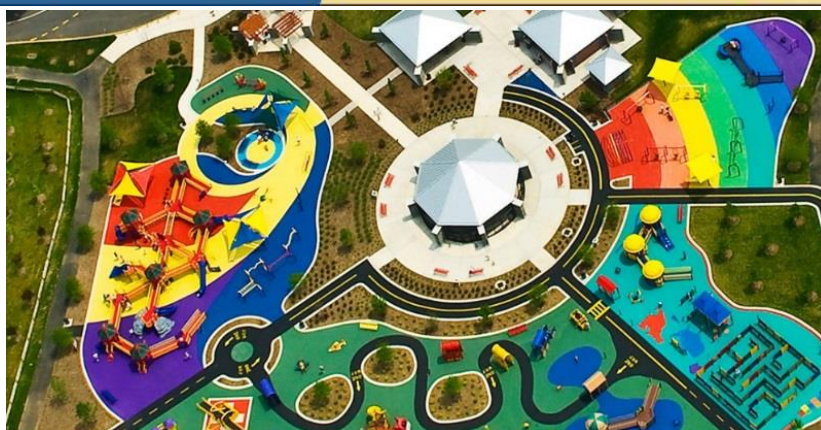
شکل شماره ۲: پارک کلمی جونتری