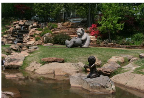
شکل شماره ۳: پارک تایلر

این پارک (شکل ۳) در شرق تگزاس قرار دارد که محیطی شاد و آموزنده برای کودکان فراهم کرده و محیطی برای گردهمایی کودکان به همراه والدینشان نیز طراحی کرده است. در ابتدا زمین به حالت طبیعی خودرها شده بود که شهرداری وقت سایت را مورد بهسازی قرار داد. امروزه دریاچه میانی آن با درختان کاج در اطراف آن پوشیده شده است که بسیاری از درختان ۷۵ تا ۱۰۰ سال قدمت دارد. درختان کاج در اغلب مناطق پارک به خصوص در نواحی خشک بیشتر به چشم می خورد. گیاهان موجود در پارک: کاج، پهن برگان شامل، سدر قرمز شرقی، گردو، افرا، گردو نارون، زغال اخته، انواع توت ها، سرو ایستاده و ... در طول مسیر هم چنین میتوان حیواناتی نظیر گورکن یا مرداب عبور. خزندگان مانند مار، سوسمار، سمندرها، قورباغه ها و وزغ را مشاهده نمود. بیش از ۲۰۰ گونه از پرندگان در پارک شناسایی شده است.