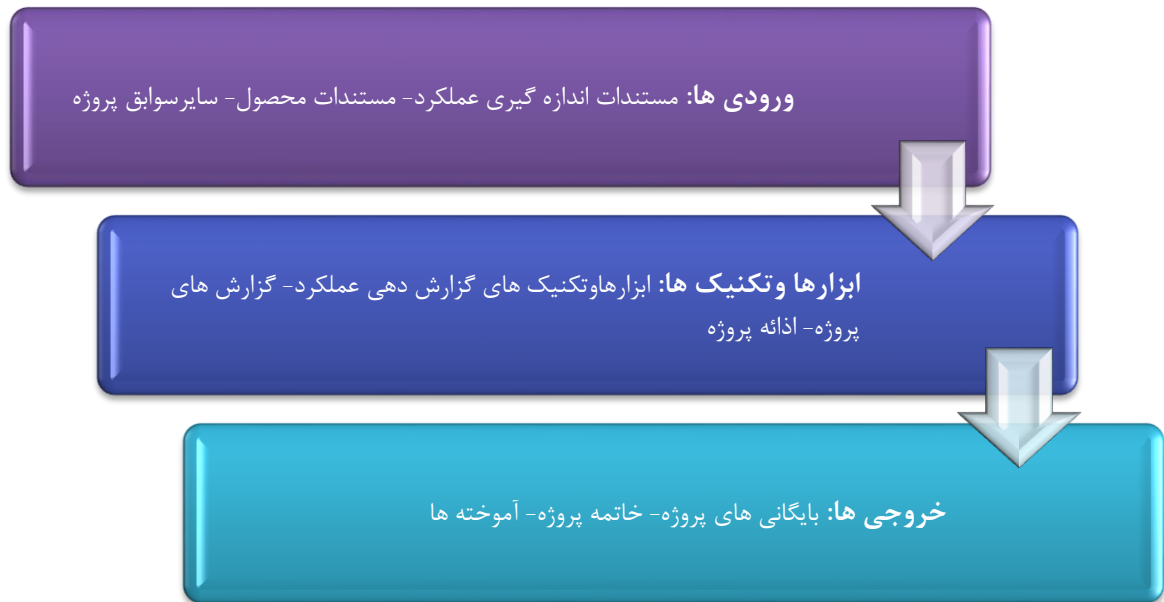
شکل ۷: فرآیند مربوط به خاتمی اداری در مدیریت ارتباطات پروژه