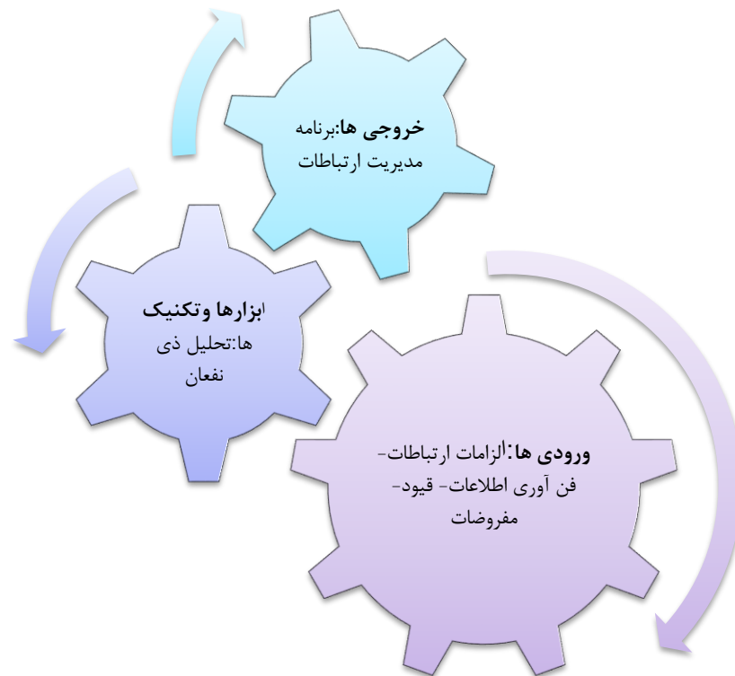
شکل ۲: فرآیند مربوط به برنامه ریزی ارتباطات در مدیریت ارتباطات پروژه

برنامه ریزی ارتباطات دربرگیرنده ی تعیین نیازهای اطلاعاتی و ارتباطاتی ذی نفعان می باشد : چه کسانی به چه اطلاعاتی نیاز دارند، چه موقع به آن نیاز خواهند داشت و چگونه و توسط چه کسی این اطلاعات به آنها داده خواهد شد . اگرچه همه ی پروژه ها در نیاز به تبادل اطلاعات پروژه سهیم هستند، اما نیازهای اطلاعاتی و روش های توزیع اطلاعات بسیار متفاوت می باشد . شناسایی نیازهای اطلاعاتی ذی نفعان و تعیین روشی مناسب جهت برآورده کردن آن نیازها، عامل مهمی برای موفقیت پروژه می باشد. در بیشتر پروژه ها، عمده ی برنامه ریزی ارتباطات به عنوان بخشی از مراحل اولیه ی پروژه انجام می شود . با این وجود، نتایج این فرایند می بایست در طول پروژه به طور منظم بازبینی گردد و در صورت نیاز به منظور حصول اطمینان از قابلیت به کارگیری مستمر، مورد تجدید نظر قرار گیرد. از آنجا که ممکن است ساختار سازمانی پروژه اثر بزرگی بر الزامات ارتباطات پروژه داشته باشد؛ اغلب برنامه ریزی ارتباطات متصل قویاً به برنامه ریزی سازمانی است.