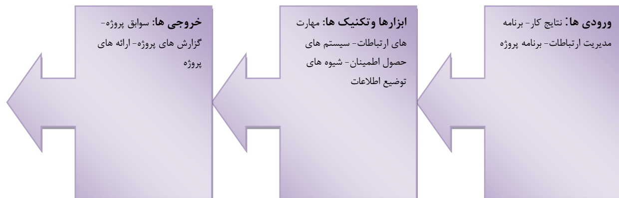
شکل ۳: فرآیند مربوط به توزیع اطلاعات در مدیریت ارتباطات پروژه

توزیع اطلاعات عبارت است از فراهم نمودن به موقع اطلاعات موردنیاز برای ذی نفعان پروژه. این فرایند، پیاده سازی برنامه ی مدیریت ارتباطات، همچنین واکنش به درخواست های غیرمنتظره ی اطلاعات را دربرمی گیرد.