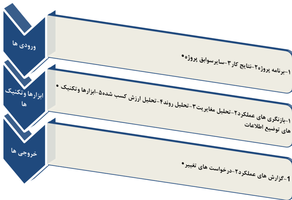
شکل ۴: فرآیند مربوط به گزارش دهی عملکرد در مدیریت ارتباطات پروژه

گزارش دهی عملکرد عموماً می بایست در مورد محدوده، زمان بندی، هزینه و کیفیت، اطلاعات فراهم کند بسیاری از پروژه ها اطلاعات ریسک و تدارکات را نیز لازم دارند. گزارش ها ممکن است به طور جامع و یا بر پایه ی یک استثنا تهیه گردند.