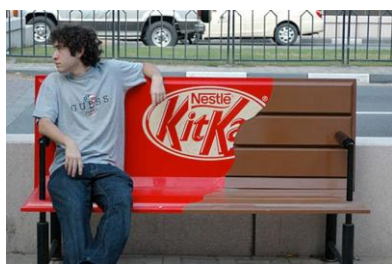
• مبلمان شهری: کاربرد تبلیغی

گرافیک محیطی به‌عنوان بخشی از اطلاع‌رسانی شهری تلاش دارد که عناصر بصری شکل‌دهنده را با اندیشه‌ای از کارکرد هدایت‌کننده و بیان سودمندی برای مخاطب عرضه نماید. درک ویژگی‌های این روش تصویری وابسته به ادراکی صحیح از نحوه طراحی عناصر شکل‌دهنده گرافیک محیطی و روش به‌کارگیری آن در تعامل با مخاطب و محیط است و اینکه محیط چه خصوصیات و قابلیت‌هایی را در رویکرد و شکل‌دهی ارزش‌های تصویری گرافیکی به‌وجود می‌آورد. (رشوند، ۱۳۹۱: ۷۵)