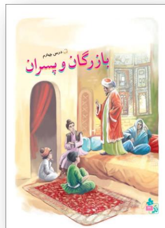
تصویر شماره ۳

جلد کتاب به عنوان معرف خلاصه‌ای از محتوای داخلی آن کتاب و به‌عنوان بیان‌کننده شخصیت اصلی کتاب مطرح می‌شود. خواه این کتاب یک داستان کوتاه باشد، خواه دیوان اشعار ادیبی بزرگ، خواه کتاب درسی که به‌عنوان رسانه آموزشی مطرح می‌شود.