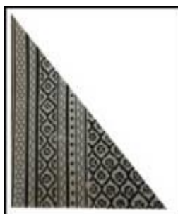
تصویر ۳- نقوش حاشیه و زمینه‌ی زیلو (نگارندگان).

در زیلو دو نوع نقش وجود دارد: نقوش حاشیه و نقوش کار یا زمینه. نقوش حاشیه در زیلو بسیار متنوع می‌باشند و گاهی برای رسیدن به نقوش زمینه، پانزده حاشیه بافته می‌شود. (تصویر ۳) هرکدام از نقوش حاشیه و زمینه، شکل و نحوه‌ی بافت خاص خود را دارند که در این مقاله به ذکر اسامی انواع آن اکتفا کرده‌ایم، به این امید که مجال پرداختن به انواع نقوش زیلو در مقاله‌های آتی میسر شود. اسامی نقوش حاشیه‌ی زیلو - از بیرون به سمت زمینه - به ترتیبی است که در ادامه می‌آید: ۱. کناره، ۲. کش، ۳. مداخل، ۴. کش، ۵. کنگره، ۶. چهارکش، ۷. بند و گل، ۸. چهارکش، ۹. کنگره، ۱۰. کش، ۱۱. مهر، ۱۲. سه‌کش، ۱۳. کنگره، ۱۴. چهارکش و نهایتاً نقش زمینه.