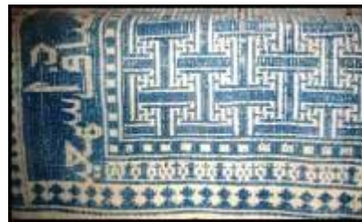
تصویر ۱- زیلو با رنگ‌های آبی و سفید مخصوص مساجد و اماکن متبرکه (نگارندگان).

می‌شود. آبی، رنگی آرامش‌بخش و همیشه متوجه درون است که در طبیعت قدرت بسیاری دارد. رنگی است که در همه‌ی ساعات در طبیعت به چشم می‌خورد؛ تنها ویژگی و روشنی آن است که تغییر می‌کند (مصدقیان، ۱۳۸۴: ص ۹۳). از آنجا که زیلو زیراندازی ساده به‌شمار می‌رود، یکی از اصلی‌ترین رنگ‌های به‌کار رفته در آن، رنگ آبی است؛ (تصاویر ۱ و ۲) اما در کنار آن، ترکیبات گوناگونی شامل آبی و سفید، مشکی و سفید، قرمز و سفید، آبی و گلی، سبز و نارنجی، فیروزه‌ای و عنابی و هم‌چنین روناسی و سفید به چشم می‌خورد. نقوش به‌کار رفته در زیلو از امکانات ترکیب و هم‌نشینی بسیار مناسبی برخوردارند. این موضوع سبب شده است تا بافنده با نظر و سلیقه‌ای که ریشه در سنت‌های گذشته دارد، اقدام به ابداعات نوینی در دست‌ساخته‌ی خود بنماید. ساختار نقوش به‌گونه‌ای است که به‌راحتی در کنار یکدیگر نشسته و به تکمیل هم می‌پردازند. زیلو دارای دو گروه نقش است: نقش «حاشیه» که در اصطلاح به آن «وج» گفته می‌شود و نقش «کار» یا «زمینه» که آن را به‌نام «نقش» می‌شناسند. نقش حاشیه معمولاً ثابت بوده و آهنگ یکنواختی دارد، اما نقش زمینه بسته به ذوق و سلیقه‌ی بافنده یا مکان مورد استفاده، تغییر می‌کند (شایسته‌فر و شکرپور، ۱۳۸۸: ص ۲۷). خاستگاه زیلوبافی خواه میبد باشد یا جای دیگر، این هنر-صنعت در میبد سابقه‌ای طولانی دارد.