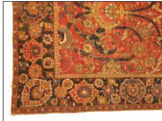
تصویر ۷: اسلیمی دهان اژدری، بخشی از اثر شماره: ۶۹، ۲۴۴