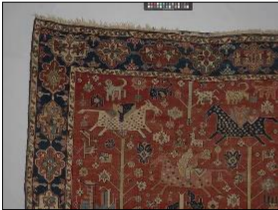
تصویر ۸: ترکیب اسلیمی شکسته و شکارگاه، بخشی از اثر شماره: ۱۹۷۱، ۲۶۳، ۷