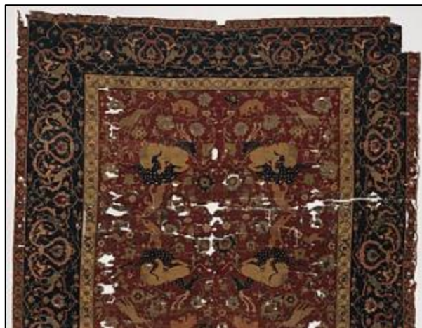
تصویر ۱۰: ترکیب گل شاه عباسی و شکارگاه (گرفت و گیر)، بخشی از اثر شماره: ۱۰، ۶۱، ۲