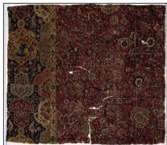
تصویر ۱۱: ترکیب گل شاه عباسی و حیوان دار، شماره اثر: ۱۹۷۰، ۳۰۲، ۱