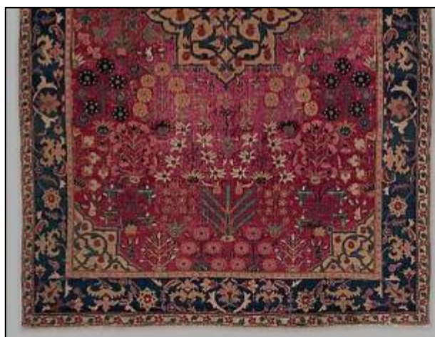
تصویر ۱۲: ترکیب گل شاه عباسی و گلدانی، نیمی از اثر شماره: ۱۹۷۰، ۳۰۲، ۲