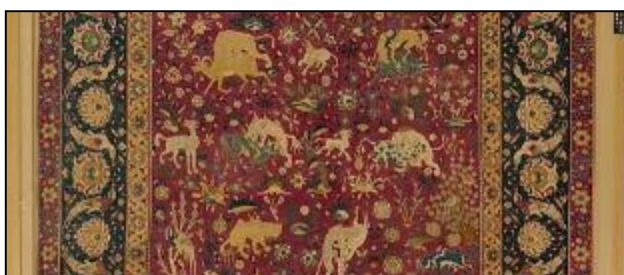
تصویر ۳: کوچکترین قطعه مجموعه، شماره اثر: ۱، ۲۷۲، ۱۹۷۴