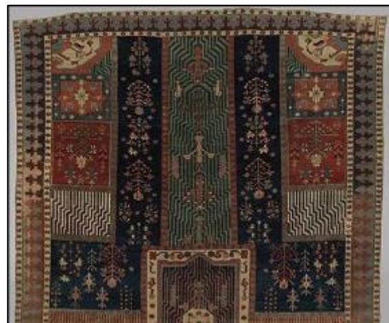
تصویر ۹: ترکیب قابی با واگیره ای و باغی، نیمی از اثر شماره: ۲۲، ۱۰۰، ۱۲۸