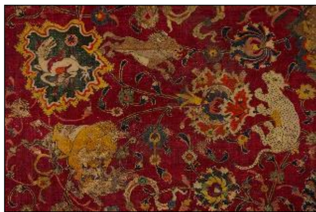
تصویر ۱: بخشی از قالی امپراتور، شماره اثر: ۱، ۱۲۱، ۴۳