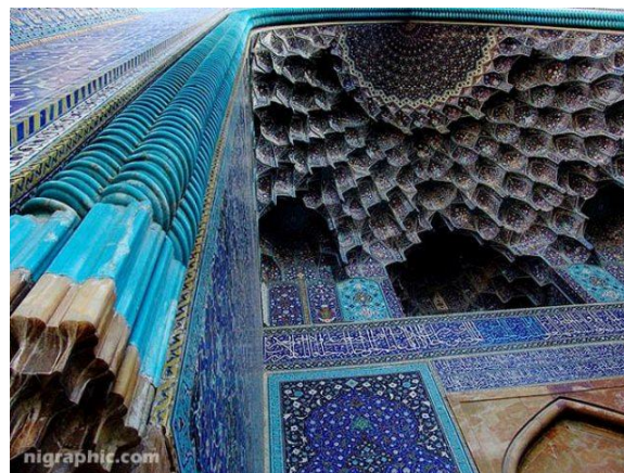
مقرنس سر در ورودی مسجد شاه اصفهان

ساخت این مسجد در سال ( ۱۰۲۰ ه.ق ) ، به دستور و هزینه شاه عباس اول و معماری استاد علی اکبر اصفهانی ، آغاز گردید و کارهای تزئینی آن تا بعد از مرگ شاه عباس اول ( ۱۰۳۸ ه.ق ) همچنان ادامه یافت . سر در ورودی مسجد شاه ، به ارتفاع ۲۶/۵ متر ، با پوششی از شبکه پر حجم مقرنس کاری نخستین قسمتی بود که از ساختمان مسجد به پایان رسید . این سر در با غنا و عظمت خود نماینده اوج هنر تزئینی ایران است . خورشیدی سر در به رنگ سرخ اخراپی به فضا گرمی می بخشد . بخشی از کندوبی های مقرنس یا لانه زنبوری های پوشاننده ورودی مسجد شاه گذشته از گستردگی شبکه هندسی زمینه این تزئینات دقت اجرا و قدرت تجسمی این طرح افسانه ای تزئینی روی سطوح مقعر در خور تحسین است . مقرنس کاری یکی از درگاهی ها که به خواجه نشین ما قبل ایوان مرتبط با مسجد شاه ، اطراف درگاه آن با ابزار مارپیچ طنابی شکل با لعابی فیروزه ای و فرود آن در دو گلدان کاشی کاری شده برجسته می باشد . فواصل نزدیک و هم سطح مقرنس کاری ها ، جلوه ساخت دقیقا هندسی و منطبق ، و کندوبی های پوشاننده قوس مقعر دیوار به خوبی به نمایش گزارده شده است . در زاویه شمال غربی حیاط مسجد ، طاق های دو طبقه ای دیده می شود که وضوح قاطع اشکال و خطوط معماری آنان در اینجا به کمالی کلاسیک رسیده است . درون قوس های زیر طاق ها در هر طبقه ، طاق نما ها کاملا صاف و صیقلی دیده می شود .