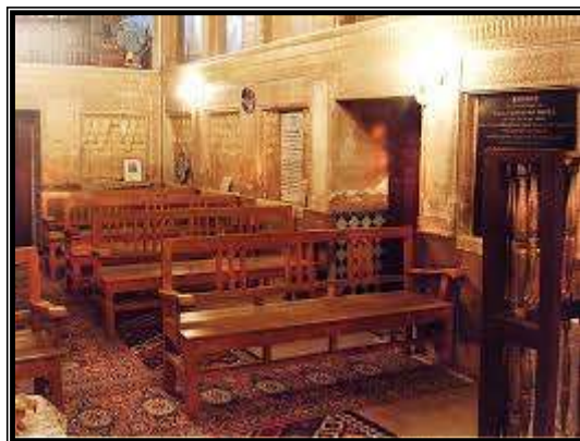
تصویر ۴- کلیسای آرامنه شیراز

زمان شاه عباس دوم صفوی در سال ۱۶۶۲ میلادی آن را ساخته اند. سقف نقاشی تالار اصلی کلیسا وطاقچه بندی و مقرنس کاریهای گچی در حاشیه وسط دیوار از آثار هنری دوران صفوی بوده سنگهای قبور شخصیت‌های مسیحی بر دیوارهای کلیسا نصب است. قابل توجه این که از داخل تالار و نمازگاه سقف نقاشی و گچبری شده و گنبدی شکل است، حال آن که از خارج و در روی پشت بام اثری از گنبد مدور و گنبدی شکل دیده نمی شود.