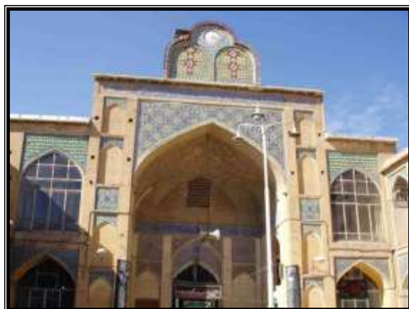
تصویر ۵- مسجد مشیر شیراز

• مسجد مشیر: این مسجد زیباترین مسجد دوره قاجار در شیراز است و به وسیله « میرزا ابوالحسن خان مشیر الملک» وزیر مملکت فارس در سال های ۱۲۶۵ تا ۱۲۷۴ ه. ق ساخته شده است. در شمال مسجد شبستان کوچکی است که با کاشی‌های رنگی منقوش زیبایی پوشیده شده و سقف دو زاویه شمالی آن به طرز زیبایی با کاشی‌های زیبا مقرنس کاری شده است. در پیشانی شبستان طاق‌نمای مرتفعی است که آیات قرآنی با خطوط درشت ثلث عالی بر آن نگاشته شده و بر فراز این شبستان دو گلدسته کاشیکاری ساخته شده است. در سمت شرق مسجد طاق‌نمای بلندی دیده می‌شود که به شکلی زیبا با کاشی مقرنس کاری شده و کتیبه‌ای به خط ثلث از آیات قرآنی دارد و در پشت طاق‌نما دالان و در بزرگ مسجد است که در بازارچه ارمنی‌ها گشوده می‌شود. این مسجد همچنین دارای یک محراب کاشیکاری بسیار زیبا و حوضی به طول ۲۵ و به عرض ۱۰ متر در وسط حیاط است.