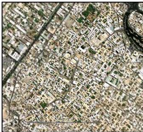
تصویر ۱- محدوده محله سنگ سیاه شیراز

حدود این محله در قدیم از طرف جنوب و جنوب غربی حصار شهر بوده واز طرف شمال به محلات میدان شاه سرباغ واز سمت شرق به محله سر دزک محدود می باشد. حدفاصل این محله و محله سرباغ محله ارامنه واقع شده که دارای کلیسا وبازارچه کوچکی است ( افسر، ۱۳۵۳).