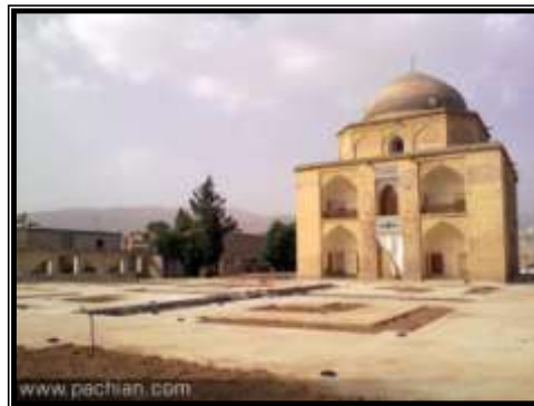
تصویر ۲- بقعه بی بی دختران