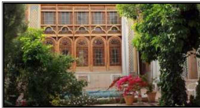
تصویر ۶- خانه فروغ الملک (موزه مشکین فام) شیراز (مآخذ: نگارنده)