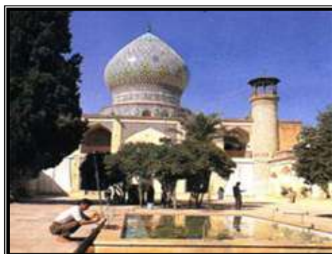
تصویر ۳- بقعه سید تاج الدین غریب