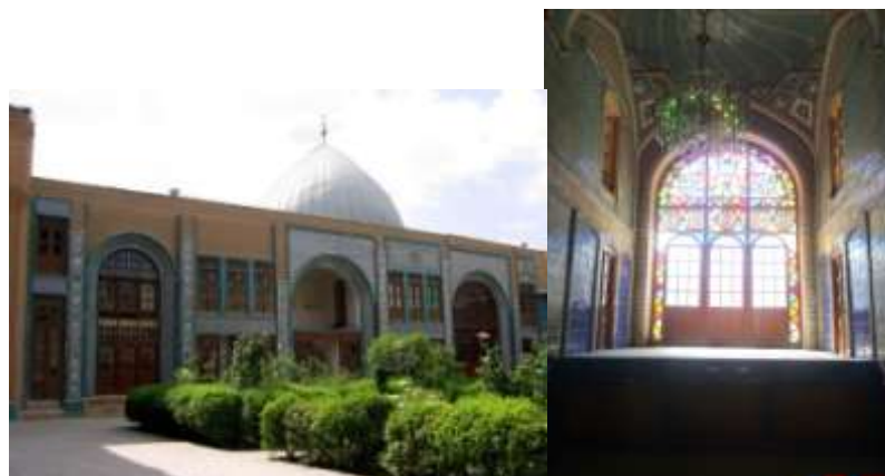
تصویر شماره ۵

حسینیه فضای محصوره که بعد از ورودی اصلی قرار دارد. (۲۰) روبروی دالان ورودی دیوار زینبیه واقع شده است که پنجره ارسی زیبای آن در بدو ورود جلب توجه می کند زیر این پنجره با دوردیف کاشی تزئین شده که در ردیف بالایی تصاویری از شخصیت های مذهبی، حکومتی و اساطیری شاهنامه و در پایین تصاویری از ابنیه و مناظر دیده میشود. (۲۱) در سه ضلع دیگر فضای حسینیه اتاق هایی در دو طبقه بنا شده که نمایی زیبا از کاشی دارند صحن حسینیه باز شو های مختلفی به فضا های کناری دارد. (۲۲) حیاط مستطیل شکل و در جهت شمالی جنوبی است بر اساس اسناد و مدارک موجود و با توجه به نوع معماری، به نظر میرسد قدمت این بخش از سایر بخش های مجموعه بیشتر است.