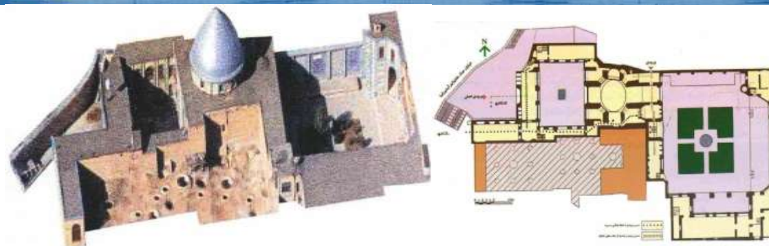
تصویر شماره ۴: پلان و تصویر سه بعدی از تکیه معاون الملک

حسینیه فضای محصوره که بعد از ورودی اصلی قرار دارد. (۲۰) روبروی دالان ورودی دیوار زینبیه واقع شده است که پنجره ارسی زیبای آن در بدو ورود جلب توجه می کند زیر این پنجره با دوردیف کاشی تزئین شده که در ردیف بالایی تصاویری از شخصیت های مذهبی، حکومتی و اساطیری شاهنامه و در پایین تصاویری از ابنیه و مناظر دیده میشود. (۲۱) در سه ضلع دیگر فضای حسینیه اتاق هایی در دو طبقه بنا شده که نمایی زیبا از کاشی دارند صحن حسینیه باز شو های مختلفی به فضا های کناری دارد. (۲۲) حیاط مستطیل شکل و در جهت شمالی جنوبی است بر اساس اسناد و مدارک موجود و با توجه به نوع معماری، به نظر میرسد قدمت این بخش از سایر بخش های مجموعه بیشتر است.