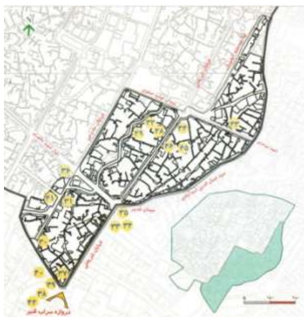
تصویر شماره ۲: (محلہ برزہ دماغ) انطباق تقریبی محلہ با نقشه وضع موجود