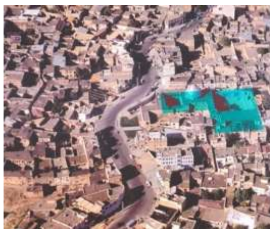
تصویر شماره ۷: خیابان حداد عادل و موقعیت تکیه

دلیل چهارمی: که شاید بتوان برای انتخاب این محل برشمرد، نزدیک بودن به مسجد جامع شهر می باشد (۵۰).