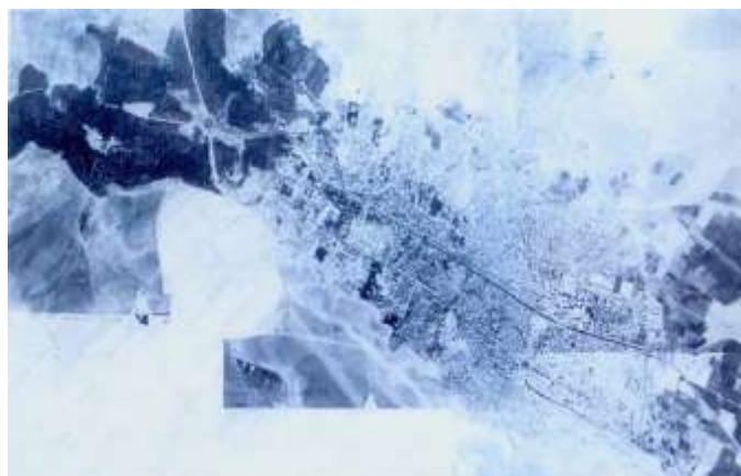
تصویر شماره ۱: عکس هوایی کرمانشاه سال ۱۳۳۵