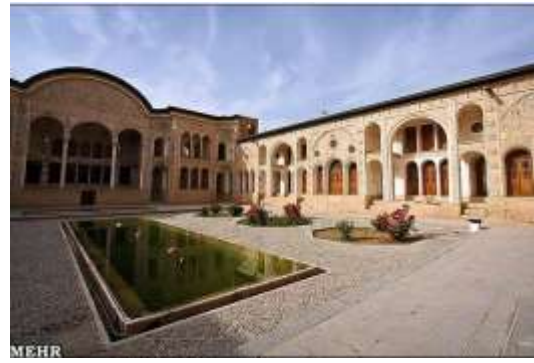
تصویر شماره ۱: