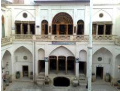
تصویر شماره ۲: