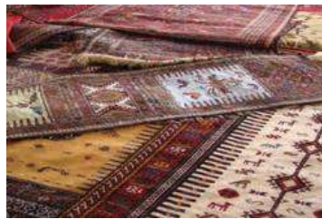
عکس ۸: جاجیم و سفره کردی