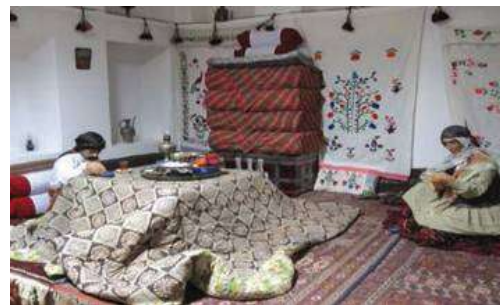
عکس ۲: نمایی از مراسم شب یلدا

هندوانه به عنوان نمادی کروی که بروش سبز و درویش قرمز و سمبل خورشید است، مهم ترین میوه بر سر سفره چله است. علاوه بر این، خوردن میوه هایی مانند انار سرخ، سیب سرخ، انگور و بیان قصه هایی از رستم و سهراب و خواندن اشعار زیبا و دلنشین از رسوم این شب محسوب می شود. همچنین در این شب خانواده داماد هدایایی را به رسم شب چلگی برای نو عروس پیشکش می برند (محلای، ۱۳۸۰).