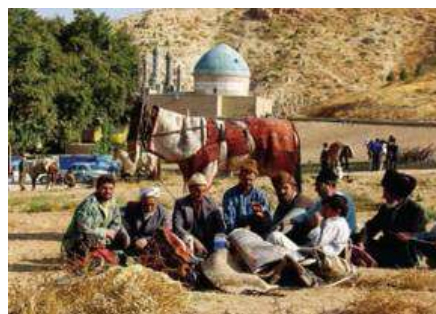
عکس ۶: مراسم اسبدوانی در بوستان بش قارداش بجنورد

وجود اسب های اصیل ترکمن زمینه ورزش اسبدوانی را در این استان فراهم کرده است. اسب ترکمن یک نژاد با قدمت طولانی و شهرت جهانی است که ارزش والایی در انجام مسابقات و جنگ ها داشته است. به دلیل سکونت اقوام مختلف همواره نگاه ویژه ای به پرورش اسب بوده است؛ به نحوی که مراسم اسبدوانی تقریباً آیین و سنت همیشگی در میان ترکمن ها، کردها و سایر اقوام می باشد که در این میان ترکمن ها اهمیت ویژه ای برای اسب و مسابقات آن به مناسبت های مختلف قائل هستند (صیادی، ۱۳۸۹).