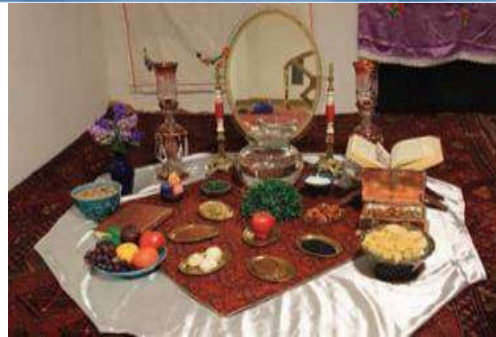
عکس ۱: سفره هفت سین