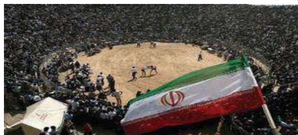
عکس ۵: مراسم کشتی با چوخه در گود زینل خان اسفراین

این ورزش در استان پیشینه ای ۲۵۰۰ ساله دارد. علاقه مردم استان به ورزش پهلوانی کشتی باچوخه را می توان در زندگی قرون گذشته آنها مورد بررسی قرار داد. حکومت های ملوک الطوایفی ساکن در این خطّه متکی بر قدرت ایلات و عشایر بود و بقای هر ایل متکی به قدرت جوانان و پهلوانان بود. در جشن ها، اعیاد مذهبی و ملی مانند عید فطر، عید نوروز و عروسی ها یکی از مراسم اصلی و مهم جشن، برگزاری کشتی با چوخه است (عبدالله زاده، ۱۳۹۰).