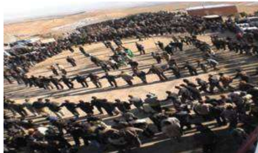
عکس ۴: مراسم عزاداری امام حسین (ع) در استان

در دهه اول محرم در اکثر نکایا و حسینیه ها با حلیم اطعام می کنند و غذای فقیر و غنی در این ماه یکسان می باشد. انجام مراسم سوگواری سید الشهداء (ع) به قدری حائز اهمیت است که آن را به صورت دینی بر گردن خود می دانند. هیئت های زنجیرزنی و سینه زنی با نظم و ترتیب در صفوف فشرده با شرکت همه اقشار مردم در سنین مختلف به گردش در می آیند. شیعیان این خطّه از انجام هر نوع مراسم شادی، حنابستن و استفاده از زیورآلات به شدت می پرهیزند (محلّاتی، ۱۳۸۰).