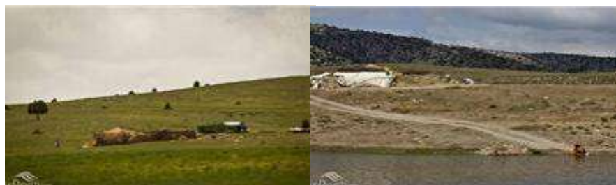
عکس ۹: منطقه حفاظت شده گولیل (گلیل) و سرانی شیروان

زحمت کش منطقه گشت و کنترل حفاظت می شود. نسبت مساحت این منطقه به مساحت کل مناطق تحت مدیریت سازمان محیط زیست خراسان شمالی ۶،۶۵ درصد است (عبدالله زاده، ۱۳۹۰).