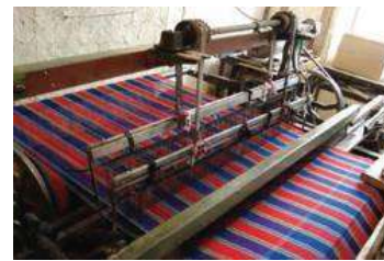
عکس ۷: چادرشب بافی در روستای روئین