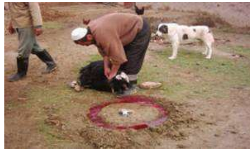
عکس ۳: رسم قربانی کردن در جرگلان بجنورد