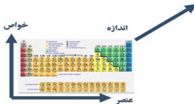
شکل ۳. طبقه بندی مواد در جدول مندلیف در آینده.

خواص مواد به دو بخش خواص فیزیکی و خواص شیمیایی تقسیم‌بندی می‌شود. تجربه نشان داده‌است که ویژگی‌های یک ماده خالص، تا حد قابل قبولی ثابت است و این امر سبب می‌شود که بتوان مواد را از روی خواص آن‌ها شناسایی کرد. اما یافته‌های دانشمندان نشان می‌دهد که یک ماده در اندازه نانو متر ویژگی‌های متفاوتی نسبت به ذرات بزرگتر خود نشان خواهند داد. این درحالیست که کوچک کردن ذرات، یک تغییر فیزیکی است و انتظار نمی‌رود که با این تغییر فیزیکی، ویژگی‌های اصلی ماده تغییر نکند. شکل (۳)