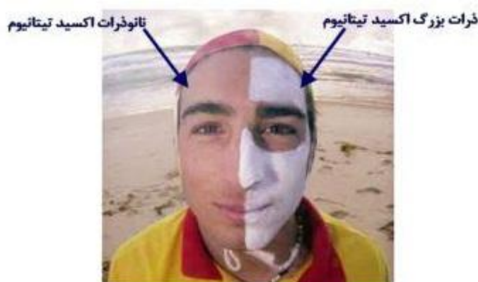
شکل ۴. تغییر رنگ ذرات اکسید تیتانیوم بر حسب اندازه