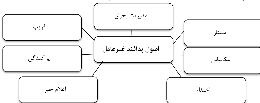
شکل (۱) اصول پدافند غیرعامل

اصول پدافند غیرعامل، مجموعه اقدامات بنیادی و زیربنایی است که در صورت بکارگیری می‌توان به اهداف پدافند غیرعامل رسید به آنها در شکل (۱) اشاره می‌شود (کمیته پدافند غیرعامل، ۱۳۹۱: ۲۰).