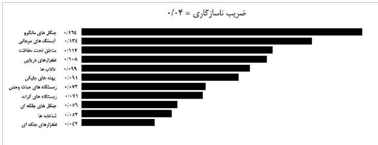
شکل ۳- ضریب اهمیت اکوسیستم های حساس شناسایی شده در منطقه ساحلی