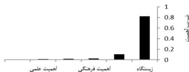
نمودار ۱- اولویت ضریب اهمیت معیارهای تعیین مناطق حساس ساحلی

مطالعه و استخراج معیارها و بررسی ضریب اهمیت آنها نشان داد معیار زیستگاه و گونه دارای بیشترین اهمیت در تعیین مناطق حساس و شاخص انحصاری بودن و بکر بودن دارای بیشترین ضریب اهمیت در تعیین این مناطق هستند (نمودار ۱ و ۲). پس از تعیین ضریب اهمیت معیارها، ضریب اهمیت اکوسیستم های منطقه ساحلی تعیین و نتیجه حاصل ضرب ضریب اهمیت معیارها در ضریب اهمیت اکوسیستم های حساس منطقه ساحلی به عنوان ضریب حساسیت اکوسیستم های این مناطق تعیین شد. اولویت بندی اکوسیستم های حساس با توجه به ضریب حساسیت مناطق تعیین و در شکل ۳ نشان داده شده است (خروجی تحلیل سلسله مراتبی). با توجه به شکل ۳ جنگل های مانگرو با ضریب ۰/۱۶۴ دارای بیشترین حساسیت و علفزارهای جلگه ای با ضریب ۰/۰۴۲ نسبت به سایر اکوسیستم های نوار ساحلی دارای ضریب حساسیت کمتری هستند.