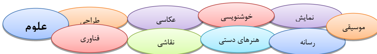
شکل ۱-۱ ساعت درسی علوم اجتماعی با رویکرد هنری.

سازمان‌دهی محتوای برنامه درسی یکی از حساس‌ترین مراحل برنامه‌ریزی درسی است که کارایی برنامه و میزان تحقق هدف‌های مهم برنامه‌ریزی بدان وابسته است. روش تلفیقی علوم اجتماعی بر اساس رویکرد تلفیقی باهنر، روش‌های سازمان‌دهی محتوا بر اساس چالش محوری و مسئله محوری و یادگیری مستقل و هدایت‌شده، جمع‌آوری اطلاعات از منابع گوناگون برخوردار است و با شیوه‌های طراحی، عکاسی، نقاشی، کاردستی، موسیقی و خوشنویسی همراه می‌باشد. ارزشیابی فرآیند نظام‌مند جمع‌آوری، تحلیل و تفسیر اطلاعات است که به منظور تعیین میزان تحقق هدف‌ها انجام می‌شود. ارزشیابی علوم اجتماعی با رویکرد هنری با توجه به ملاک‌های زیر انجام می‌شود: - خلاقیت همچون پیدا کردن راه حل مناسب، خلق اثر هنری غیرمرسوم و غیر کلیشه‌ای و نظایر آن.