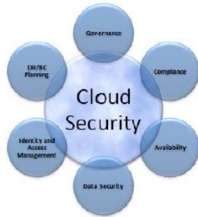
شکل ۶. تهدات امنیتی ابر