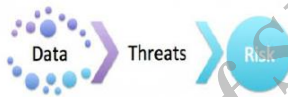
شکل ۲. نگرانیهای امنیتی محاسبات ابری

مشکل اساسی که رخ می دهد این است که اگر به نگرانیهای امنیتی رسیدگی شده باشد و مکانیزمی برای امنیت دادهها مستقر شده باشد، هزینهها بسیار زیاد خواهند بود هدف کلی ابر داشتن هزینههای کمتر است اما اگر مکانیزمهای امنیتی مستقر شده باشند، آنها خواستار سرمایه بزرگ برای سرمایه گذاری هستند. این یک مسئله باز برای مشتری و همچنین ارائه دهنده سرویسهای ابری است. به این دلیل، یک علامت سوال در اعتبار محاسبات ابری وجود دارد.