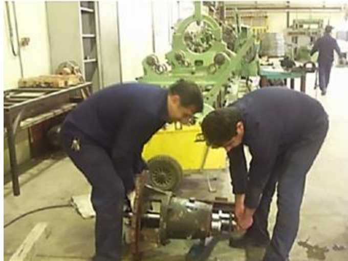
شکل ۱- تکنسین تعمیرات توربین

در شاغلین مورد مطالعه در شرکت مدیریت تولید برق امتیاز نهایی REBA دارای میانگین و انحراف معیار 9/94 \pm 2/12 و محدوده ۶-۱۳ بود. ارزیابی ریسک پوسچرهای کاری نشان داد که هیچ یک از وظایف در شرکت مدیریت تولید برق مورد مطالعه دارای سطح ریسک بسیار کم و کم نبودند و پوسچر کاری افراد با (.15/5) ، (.33/62) و (.50/0) به ترتیب دارای سطح ریسک متوسط، بالا و بسیار بالا بودند. در جدول ۴، امتیاز نهایی ارزیابی ریسک به روش REBA در وظایف مختلف آورده شده است. در شاغلین شرکت مدیریت تولید برق بین سن و سابقه کار با درد کمر، زانو و دست، ارتباط معنی‌داری یافت شد ( p < 0/05 ).