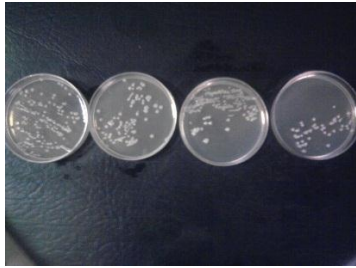
تصویر 2- کلنی های باکتریایی آگروباکتریوم ویتیس