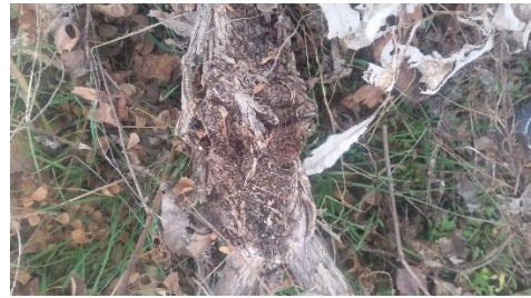
تصویر 1- نمایی از درخت انگور آلوده به گال طوقه