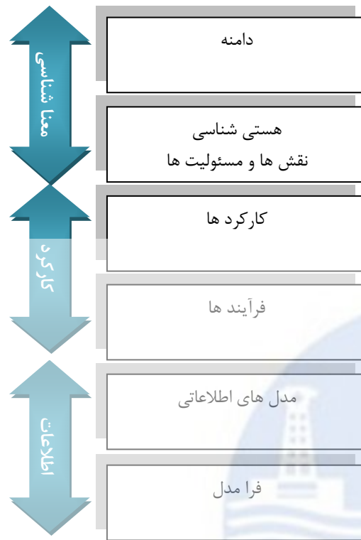
شکل ۲) جزئیات سطوح ادراکی و منطقی