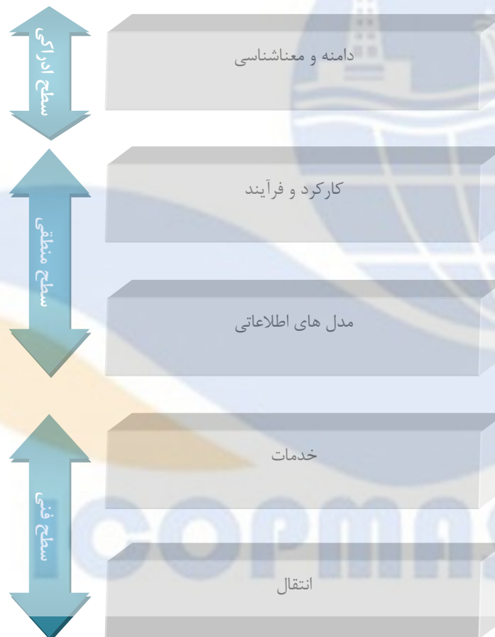
شکل ۱) اجزای معماری سیستم های حمل و نقل هوشمند دریایی

در این بخش اجزای اصلی معماری سیستم های حمل و نقل هوشمند دریایی پیشنهادی، را شرح خواهیم داد. (شکل ۱)