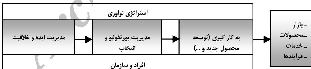
شکل شماره 3. مدل مدیریت نوآوری [9].

نوآوری، بندرت به صورت خود به خودی در سازمان ها اتفاق می افتد. در اکثر موارد برای راه اندازی نوآوری در سازمان چندین عامل توانمند کننده وجود دارند که عبارتند از: فرآیندها، سیستم ها و ساختارها، فرهنگ، شایستگی ها و شبکه ها. تحقیقات مختلف نشان داده اند که سازمان ها یک رویکرد ساختاریافته را جهت اجرای بهتر نوآوری در سازمان پذیرفته اند. البته یک رویکرد رسمی برای اجرای نوآوری، بتنهایی موفقیت آن را تضمین نمی کند. در شکل شماره 3 یک مدل پنج مرحله ای برای مدیریت نوآوری نشان داده شده است.