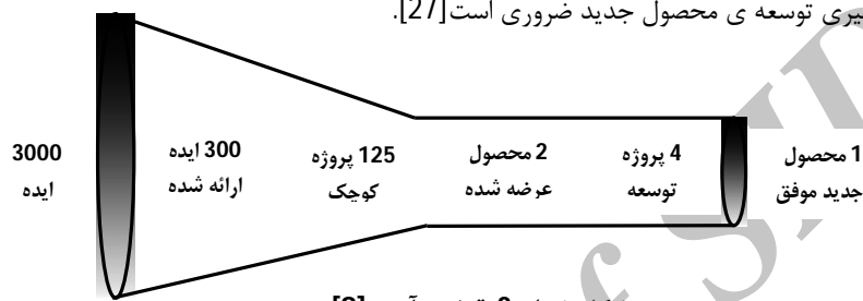
شکل شماره 2. قیف نوآوری [8].

البته باید توجه داشت که اغلب ایده های نوآورانه به محصولات یا خدمات جدید و موفق تبدیل نمی شوند. مطالعه ها نشان می دهد که حدود 3000 ایده خام لازم است تا یک محصول کاملاً جدید و از نظر تجاری موفق به وجود آید. بنابراین فرآیند نوآوری را اغلب به صورت یک قیف ترسیم می کنند [8]. کارکرد نظام پذیرش و بررسی پیشنهادها در گردآوری حجم وسیعی از ایده ها مشابه این قیف عمل می کند. از آن جا که نوآوری با تولید ایده های جدید شروع می شود، تولید ایده برای نوسازی و موفقیت شرکت ها بسیار مهم است [24]. بنابراین بررسی انبوهی از ایده ها و ارزیابی آن ها برای تصمیم گیری توسعه ی محصول جدید ضروری است [27].