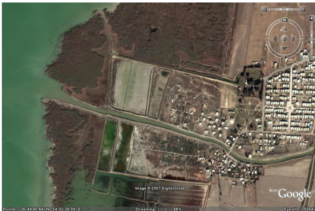
تصویر ماهواره ای مصب رودخانه قره سو و روستای قرسو در ضلع شرقی خلیج گرگان

رودخانه قرسو به عنوان اصلی ترین رودخانه تامین کننده آب شیرین خلیج گرگان محسوب می شود. در کلیه رودخانه های حوضه آبخیز قره سو، متوسط دبی ماه آبان در شش ماهه اول سال آبی، کمتر از سایر ماههای پائیز و زمستان بوده و سپس افزایش تدریجی آبدهی تا فروردین و ندرتاً تاردیبهشت ادامه داشته، سپس بعلت بهره برداری اراضی حقا به بر، شدیداً کاهش آبدهی در ماههای خرداد تا شهریور ملاحظه می گردد.