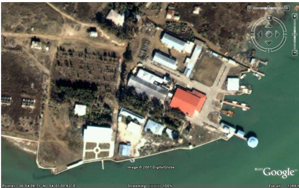
تصویر ماهواره ای تاسیسات شیلات استان گلستان واقع در جزیره آشوراده خلیج گرگان

آبخیز خلیج گرگان یکی از یکی از مهمترین کانونهای زراعی کشور در استان گلستان می باشد. عمده ترین محصولات زراعی این محدوده عبارتند از جو، گندم، پنبه، شلتوک و سوتا. حدود دو سوم فعالیت های زراعی بصورت دیم و یک سوم بصورت آبی صورت می گیرد. علاوه بر محصولات مذکور، محصولاتی نظیر خسیل، کاهو، ترب، اسفناج، هندوانه، کدو، سیب زمینی، گوجه فرنگی، سایر محصولات علوفه ای، سبزیجات و جالیزی، خیار و شدر نیز بخشی از فعالیتهای زراعی این محدوده را به خود اختصاص داده اند. تولید محصولات باغی نیز از دیگر فعالیتهای کشاورزی این منطقه است و هلو، نارنگی، پرتقال، زیتو، گردو و کیوی از آن جمله اند و سهم عمده تولیدات باغی استان گلستان را تشکیل می دهند.