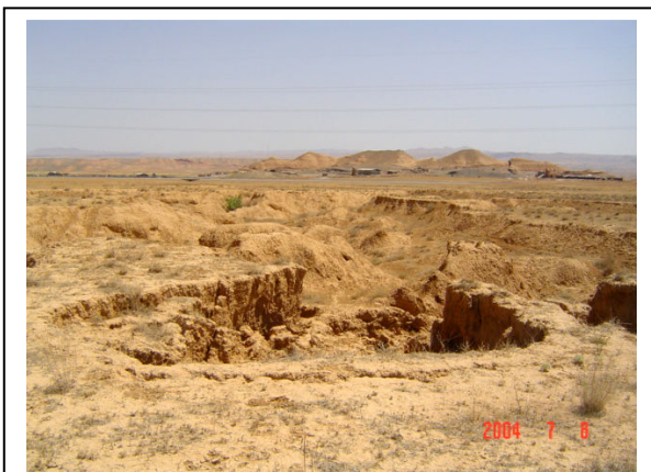
شکل (۲)- نمونه‌ای از فرسایش خندقی در مناطق دشتی گمیش‌آباد

۱- عبدی، پرویز، جمال قدوسی، علی عبدی‌نام، فرهاد آقاجانلو، ۱۳۸۴. طبقه‌بندی عوامل مؤثر بر گسترش فرسایش خندقی در مارنهای زیر حوزه آبخیز گمیش‌آباد زنجان، مرکز تحقیقات کشاورزی و منابع طبیعی استان زنجان،