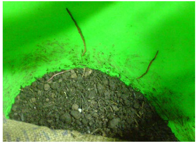
تصویر شماره (۳) : نحوه فرار کرم های خاکی از بسترهای مختلف

پس از گذشت دو روز تیمارهای مذکور مجددا مورد ارزیابی قرار گرفتند. در این مرحله مشاهده شد، که تعدادی از کرم های خاکی که از بسترها خارج نشده بودند، تماما از بین رفته و دچار پوسیدگی و تجزیه شده اند. در تصویر شماره (۴)، اجساد پوسیده کرم های خاکی در سطح تیمارهای مختلف مشخص می باشد.