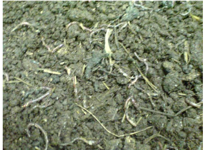
تصویر شماره (۴) : اجساد پوسیده کرم های خاکی در سطح تیمارهای مختلف