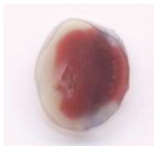
شکل ۱: ناحیه انفارکته شده میوکارد (رنگ زرد متمایل به سفید)

محلول اوانس بلو ۲ درصد از ورید وناکاوا ۱۴ تزریق شد تا ناحیه ایسکمی قرمز رنگ از ناحیه سالم آبی رنگ متمایز شود. در نهایت تحت بیهوشی عمیق، قلب حیوان از بدنش جدا شد و پس از سست‌وشو با آب مقطر و جدا کردن دلیلهای، ریشه عروق و ضامم اضافی آن، در داخل فویل آلومینیومی پیچیده و تا روز بعد در داخل فریزر قرار داده شد. پس از خارج کردن قلب از فریزر با کمک قالب‌های مدرجی، برش‌های یک میلی متری از بطن چپ (از قاعده به آپکس) تهیه شد. برش‌ها به مدت ۲۰ دقیقه در محلول تری فنیل تترازولیوم (TTC) ۱۵ در دمای ۳۷ درجه قرار داده شد و سپس برش‌های قلب به مدت ۲۴ ساعت در فرمالدهید (۱۰ درصد) قرار داده شد. تترازولیوم با عبور از دیواره سلولی و واکنش با آنزیم‌های دهیدروژناز درون سلولی در بافت ایسکمی (زنده) سبب می‌شد که این نواحی به رنگ قرمز تیره در بیاید. اما نواحی انفارکته به دلیل نکروزه شدن و از دست دادن آنزیم‌های دهیدروژناز درون سلولی نمی‌توانستند با تترازولیوم واکنش نشان دهند و به همین دلیل این نواحی به رنگ زرد متمایل به سفید در می‌آمدند. در انتها با استفاده از نرم‌افزار فتوشاپ نسبت ناحیه انفارکته شده به بطن چپ نمونه‌های اسکن شده، تحت عنوان اندازه انفارکتوس اندازه‌گیری شد (شکل شماره ۱).