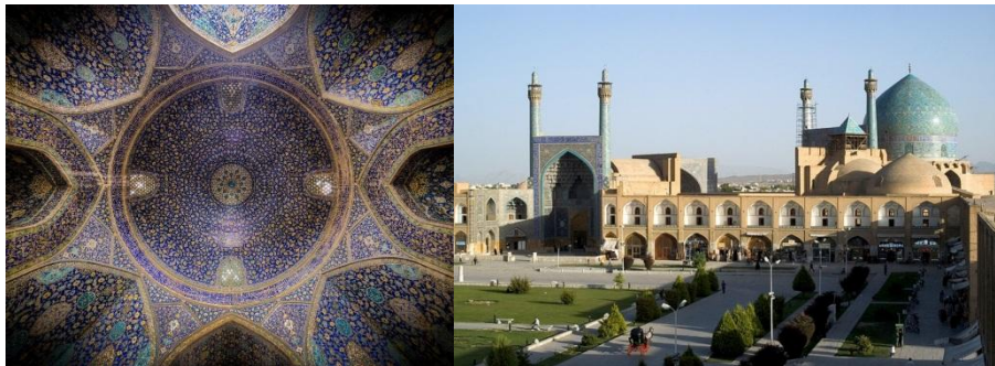
شکل ۲: مسجد امام اصفهان، راست: نمای بیرونی گنبد از میدان نقش جهان. چپ: نمای داخل

قله گنبد داخل مسجد امام را که مستقیماً در زیر گنبد به شکل درخت زندگی قرار گرفته است می‌توان دریافت. این وضعیت سمت‌الرأس خورشید، از طرفی، جایگاه و ورود به ملکوت را نشان می‌دهد»، معماریان به تعبیر دیگری از استیرلن (۱۳۷۷) اشاره می‌کند که «این درخت در متن باغ بهشت که مسجد نماینده آن است همان درخت همیشگی مشرق زمین است ... گنبد یک نشانه است، بندرگاهی طبیعی است. جان‌پناهی است که از دوردست‌ها و اعماق بیابان تشخیص داده می‌شود. درخت بهشت است. برج نشانه‌ای است که خبر از وجود چشمه آب حیات می‌دهد. مرکز دنیاست. محوری است که خودش ساکن است اما در اطرافش چرخش گرداب‌گونه هستی زمین برپاست ... اگر این سلسله تصاویر فوق‌العاده سمبلیک را دنبال کنیم به این برداشت هم خواهیم رسید که محراب، در پای گنبد، در زیر آفتابی که از فراز گنبد داخل مسجد امام به درون می‌تابد به نوعی در حکم دری است که به سوی خدا رهنمون می‌شود، راهی است که به الهه می‌رسد. به همین دلیل است که مؤمنان می‌باید، در هنگام نماز رو به سوی آن داشته باشند». (شکل ۲)