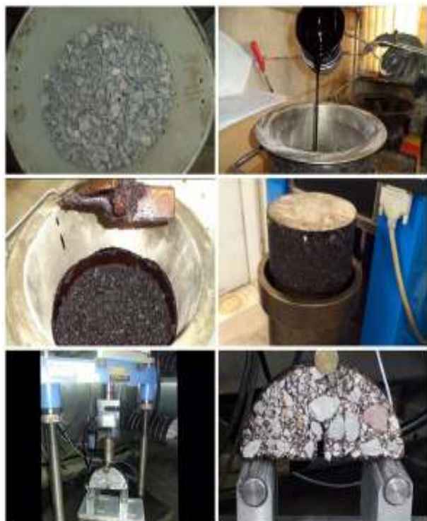
شکل ۲. ساخت نمونه‌ها و انجام آزمایش شکست

قائم دقیقا در وسط دو تکیه گاه قرار گرفته باشد. بارگذاری با سرعت ۰/۵ میلی متر بر دقیقه شروع شد و تا لحظه‌ی شکست کامل نمونه‌ها ادامه یافت. انرژی شکست هر یک از نمونه‌ها بدست آورده شد. شکل مراحل مختلف ساخت نمونه و انجام آزمایش شکست را نشان می‌دهد.