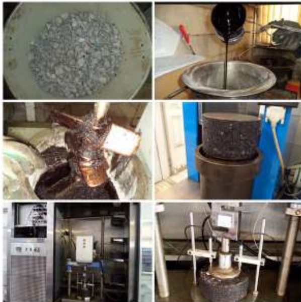
شکل ۳. مراحل ساخت نمونه‌ها و انجام آزمایش خزش دینامیکی