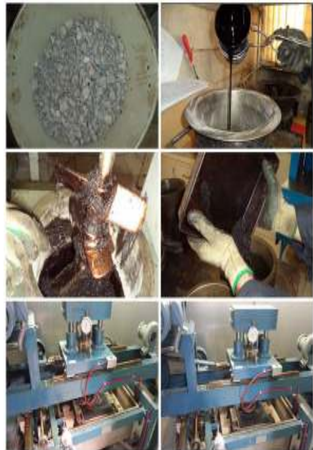
شکل ۲. مراحل ساخت نمونه‌ها و انجام آزمایش شیارشدگی

نتایج آزمایش خستگی بارگذاری کشش غیر مستقیم پس از به دست آوردن نتایج آزمایش خستگی بارگذاری کشش غیر مستقیم برای هر یک از نمونه‌ها، مقدار میانگین تعداد سیکل بارگذاری برای هر نوع ماده- درصد محاسبه شد.