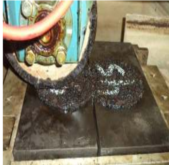
شکل ۳. نحوه‌ی قرارگیری دو نمونه‌ی ژیراتوری در کنار یکدیگر برای انجام آزمایش شیارشدگی

این آزمایش مطابق با استاندارد EN12697-25 و با استفاده از UTM انجام شد. این آزمایش در دمای ۵۰ درجه سانتی گراد انجام شد. پیش از شروع سیکل‌های بارگذاری، تنش پیش بارگذاری به میزان ۱۰ کیلو پاسکال به مدت ۱۰ دقیقه بر روی نمونه‌ها اعمال گردید. نمونه‌های استوانه‌ای به قطر و ارتفاع ۱۵ و ۶ سانتی‌متر تحت بارگذاری سیکلیک به میزان ۳۰۰ کیلو پاسکال قرار داده شدند. هر سیکل بارگذاری شامل یک ثانیه اعمال بار و یک ثانیه استراحت بود. نمونه‌های آزمایش تا رسیدن به ۶ درصد کرنش تحت بارگذاری قرار خواهند داشت. شکل ۳ مراحل ساخت نمونه‌ها و انجام آزمایش خزش دینامیکی را نشان می‌دهد.