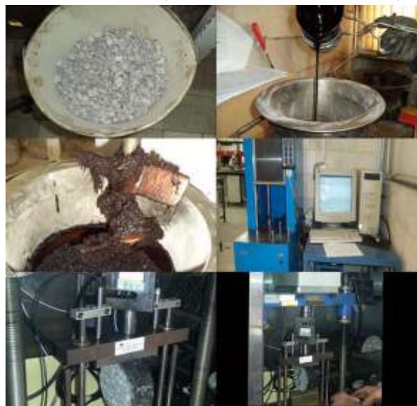
شکل ۱. ساخت نمونه‌ها و انجام آزمایش بارگذاری کشش غیر مستقیم

پیش از انجام آزمایش، نمونه‌ها به مدت ۸ ساعت در چمبر با دمای ۲۰ درجه‌ی سانتی‌گراد قرار داده شدند. نمونه‌های ژیراتوری با قطر ۱۰ سانتی متر (۴ اینچ) و در دمای ۲۰ درجه‌ی سانتی گراد، بصورت قطری تحت بارگذاری تکراری با شدت ۴۵۰ کیلوپاسکال قرار داده شدند. هر سیکل بارگذاری در این آزمایش برابر ۱/۵ ثانیه بود که ۰/۲۵ ثانیه برای بارگذاری و ۱/۲۵ ثانیه برای استراحت در نظر گرفته شد. معیار گسیختگی نمونه در این آزمایش، تغییر شکل قطری ۹ میلی متر و یا شکسته شدن آن، تعریف شده است. این آزمایش بر اساس استاندارد EN12697-24 صورت گرفت. بارگذاری با استفاده از UTM انجام شد. شکل ۱ مراحل مختلف ساخت نمونه و انجام آزمایش بارگذاری کشش غیر مستقیم را نشان می‌دهد.