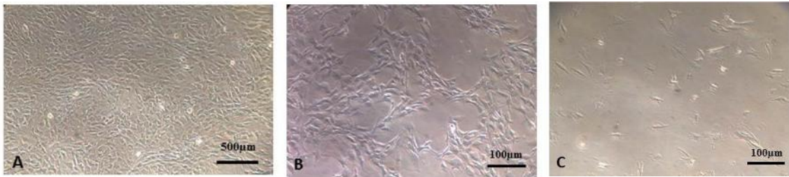
شکل ۱ - A: سلول‌های بنیادی مزانشیمال با ظاهری همانند فیبروبلاست و گسترده شده به آسانی در محیط کشت؛ B: سلول‌های بنیادی مزانشیمال مواجهه یافته با کلرید کبالت و عدم تغییر در مورفولوژی؛ C: سلول‌های مزانشیمالی پیش‌شرطی نشده با تعداد کاهش یافته