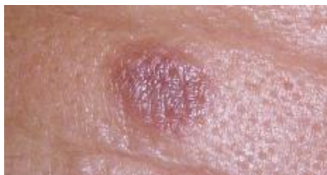
شکل ۱: پاپول اریتماتوز در ناحیه پیشانی

گرانولوم فاشیال به طور تیپیک با ضایعات ندولار و بدون علامت روی صورت مشخص می‌شود. اما گاهی درگیری پوست در نواحی غیر از صورت نیز دیده می‌شود. در این بیماری درگیری سیستمیک وجود ندارد و تشخیص قطعی گرانولوم فاشیال بر اساس مشاهدات بالینی و آسیب‌شناسی می‌باشد. این بیماری نسبتاً نادر است و اغلب در مردان میانسال دیده می‌شود (۱).