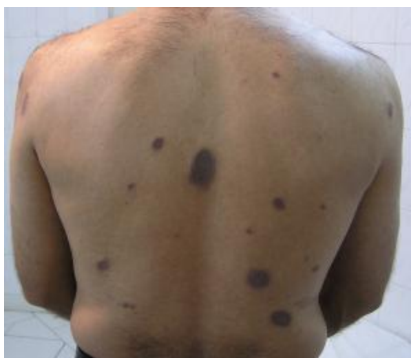
شکل ۲: پاپول‌ها، پلاک‌ها و ندول‌های اریتماتوز متمایل به بنفش در ناحیه پشت

در معاینه پوست ندول‌ها و پلاک‌های اریتماتوز همچنین به رنگ پوست در ناحیه پشت، بازوها و در ناحیه پیشانی مشهود بود. در سطح بعضی از ضایعات Follicular opening و تلاژکتازی دیده شد. در معاینه سیستمیک بیمار نکته غیرمعمول یافت نشد (شکل‌های ۱ و ۲ و ۳).