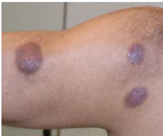
شکل ۳: پلاک‌های اریتماتوز متمایل به بنفش در ناحیه بازو

در آزمایشات به عمل آمده (اسمیر خون محیطی، CBC، Diff، سدیماتاسیون، S/E Liver function tests و U/A) و