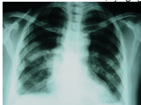
شکل ۱- رادیوگرافی قفسه سینه

این مدت ۱۰ کیلوگرم کاهش وزن داشت. علی رغم دریافت آنتی بیوتیک های مختلف به صورت سرپایی بهبودی حاصل نکرده و بستری گردید. وی سابقه دیابت، فشار خون بالا و هیپرلیپیدمی از چهار سال قبل داشته و تحت درمان با گلی بن کلامید، متفورمین، آمیلودیپین و جمفیروزیل بود. بیمار خانه دار بوده و سابقه تماس با عوامل آلاینده محیطی را نداشت. در معاینه، دمای بدن ۳۸/۵ درجه سانتی گراد بود، ضایعه پوستی و لنفادنوپاتی محیطی وجود نداشت. در معاینه قفسه سینه مختصر کراکل خشن به طور پراکنده سمع شد، کبد و طحال اندازه طبیعی داشتند. رادیوگرافی و سی تی اسکن قفسه سینه بیمار، ندول های متعدد دوطرفه، بیشتر در لوب های فوقانی را نشان داد. لنفادنوپاتی مدیاستینال و پلورال افیوژن وجود نداشت (شکل های ۱ و ۲).