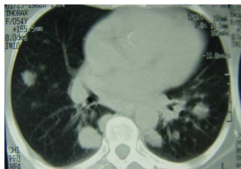
شکل ۲- سی تی اسکن قفسه سینه