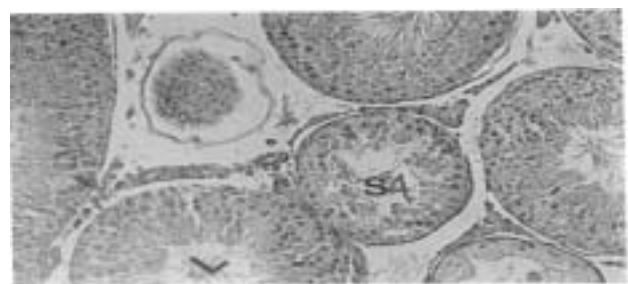
شکل ۳ - فوتومیکروگراف مقطع بیضه در موش صحرائی پس از مصرف مترونیدازول روزانه ۴۰۰ میلی‌گرم بر کیلوگرم در روز: لوله‌های اسپرم ساز با بافت بینابینی دیده می‌شود. پیکنوز در سلول‌های لیدیگ (LC) دیده می‌شود. کاهش تعداد اسپرماتوزوئیدها (S4) نیز واضح است. (بزرگ‌نمایی ۲۱۰۰)