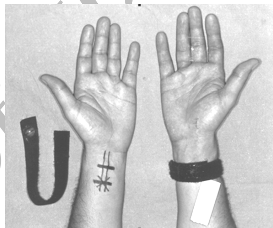
تصویر شماره ۱- محل نقطه مریدین پریکاردیوم ۶ و طریقه صحیح بستن مچ‌بند طب فشاری

Lee و همکارانش یک متا آنالیز انجام دادند و مشاهده کردند که روش‌های غیر دارویی شامل طب سوزنی، طب سوزنی الکتریکی، تحریک عصب از طریق پوست (TENS) و طب فشاری اثر بسیار بالاتری در مقایسه با پلاسبو در پیشگیری از تهوع و استفراغ بعد از عمل در ۶ ساعت اول بعد از جراحی در بالغین دارند ولی در کودکان این نفع را ندارند (۱۴). در مطالعه دیگری که به وسیله شلاگر و همکاران انجام شد، استفاده از دیسک طب فشاری موجب مهار چشم‌گیر استفراغ به دنبال عمل لופی چشم شده است (۱۵). نتایج مطالعه ما نشانگر آن است که استفاده از طب فشاری بر روی نقطه PC6 به صورت دو طرفه موجب کاهش چشمگیر و معنی‌دار بروز تهوع و استفراغ در ساعات ۶ و ۲۴ بعد از عمل می‌گردد ( P < 0/05 ) (جدول شماره ۱). همچنین طب فشاری میزان بروز تهوع و استفراغ را در اتاق بهبودی کاهش می‌دهد ولی این کاهش چشمگیر نیست. نتایج دو مطالعه فوق با نتایج پژوهش ما همخوانی دارد.