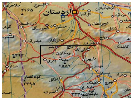
شکل ۱- موقعیت منطقه مورد مطالعه و راه‌های دسترسی به آن

شوشونیت‌ها: مشخصه این سنگ‌ها داشتن پلاژیوکلازهای درشت و فراوان است. الیومین‌های کلریتی شده، کلینوپیروکسن، آنالسیم، آپاتیت و مگنتیت نیز سایر کانی‌های این سنگ‌ها هستند. در چند نقطه، این سنگ‌ها دارای درز و شکافها و حفرات فراوانی هستند که در این