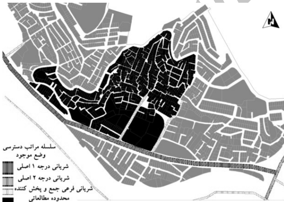
تصویر شماره ۱: نمونه‌ای از خیابان‌ها و کوچه‌های محدوده ایبوردی