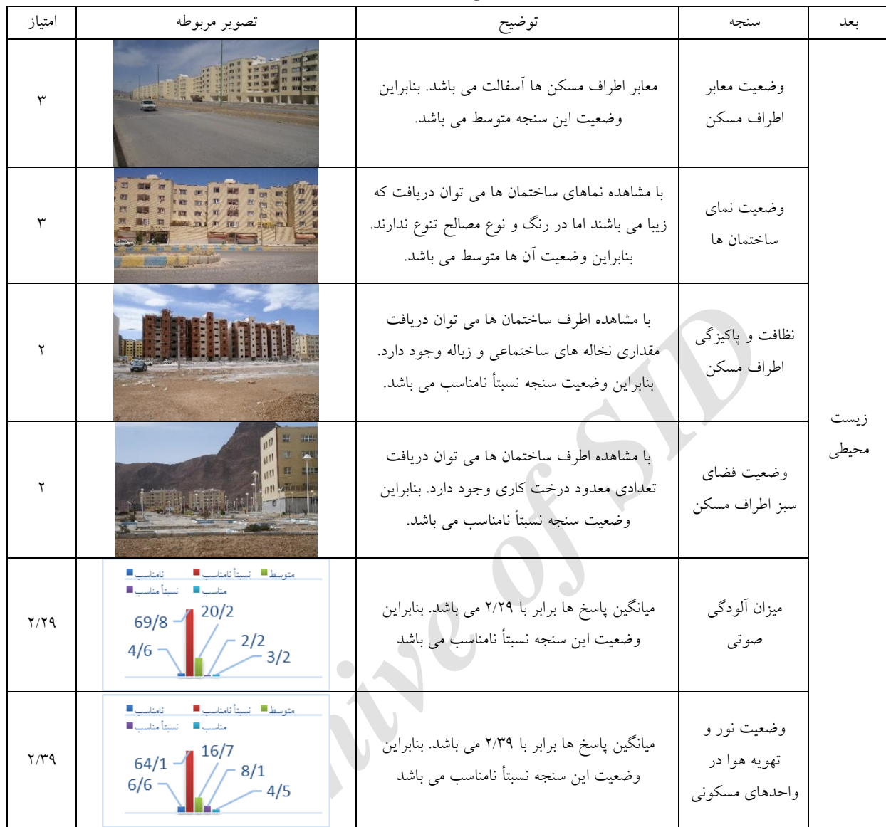
جدول ۶- امتیازدهی سنجه های ارزیابی طرح مسکن مهر شهر شهرضا به لحاظ بعد زیست محیطی