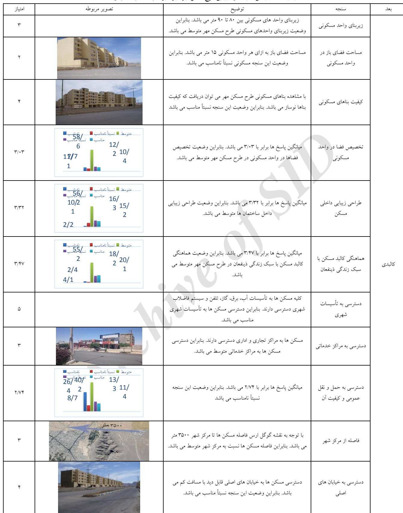
جدول ۷- امتیازدهی سنجه های ارزیابی طرح مسکن مهر شهر شهربان به لحاظ بعد کالبدی