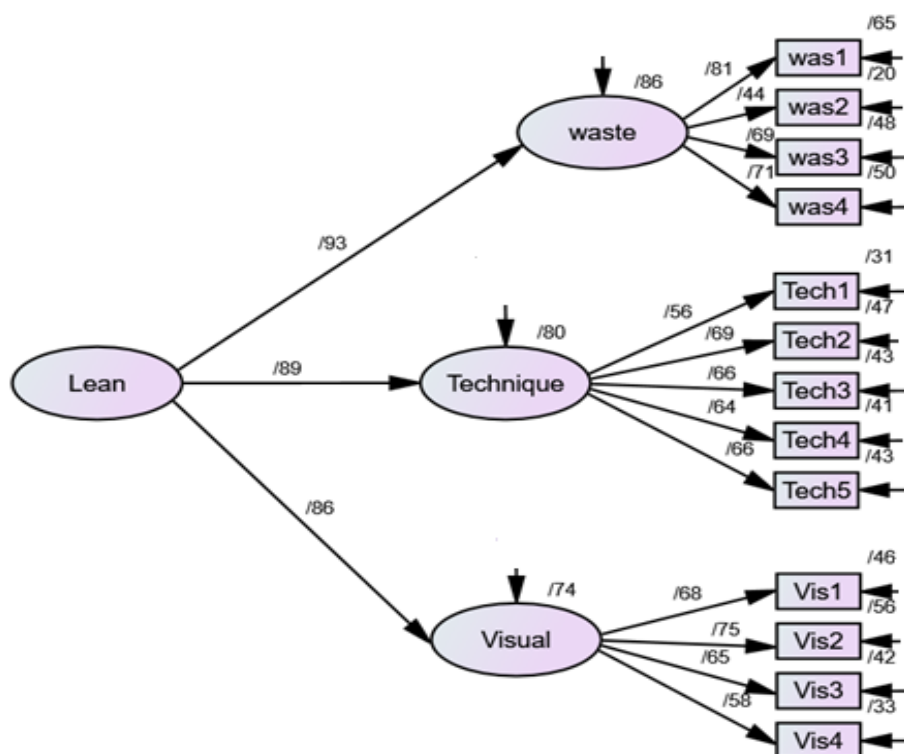
شکل ۲ - مدل تحلیل عاملی تاییدی مرتبه دوم عوامل کنترل اتلاف، تکنیک‌های ناب و سیستم‌های دیداری بر مدیریت ناب