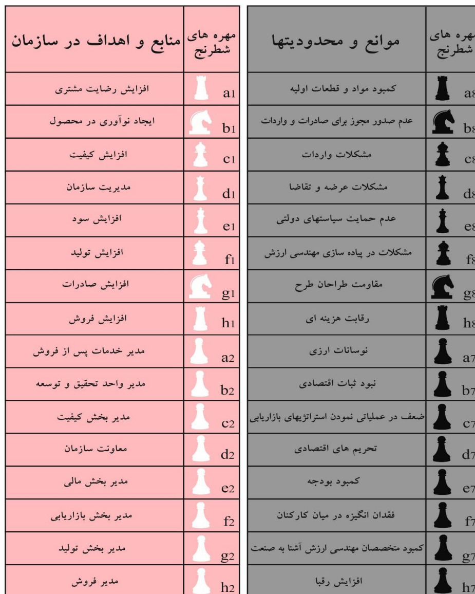
جدول (1): تعریف مولفه های سازمان بر اساس مهره های شطرنج

قواعد شطرنج و استراتژیهای مدیریتی در جهت رسیدن به اهداف مورد بررسی قرار دادیم تا از طریق تجربی بهترین و مناسب ترین روش برای رسیدن به هدف اصلی سازمان را برگزینیم. این 32 سناریو را پس از طراحی، در نرم افزار ارنا پیاده سازی کردیم، نتایج حاصل از این نرم افزار به صورت زیر می باشد: