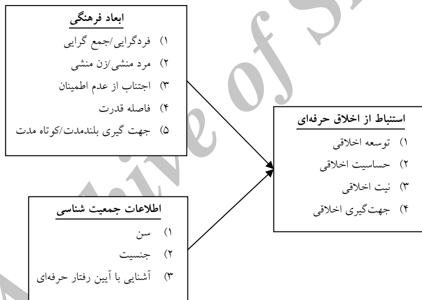
شکل (۱): مدل و چارچوب پژوهش

با توجه به فرضیه‌های پژوهش مدل و چارچوب این پژوهش به صورت شکل ۱ خلاصه شده است: